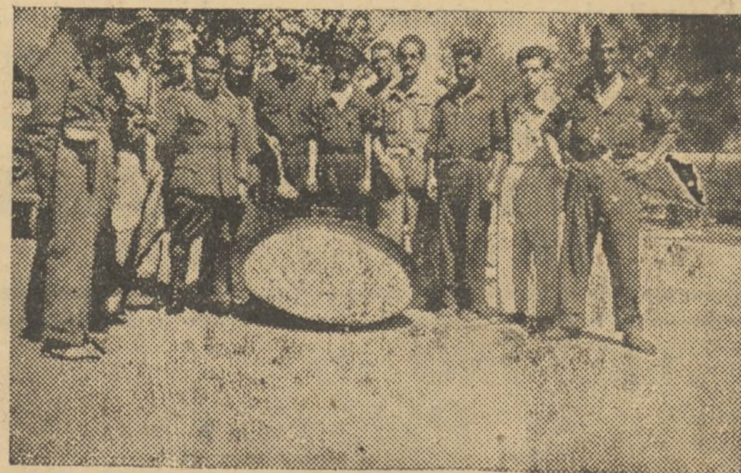
GUADARRAMA. — MOMENTO DE SERVIR LA PAELLA VALENCIANA, A LOS DEL REGIMIENTO DEL 9.º Y MILICIANOS