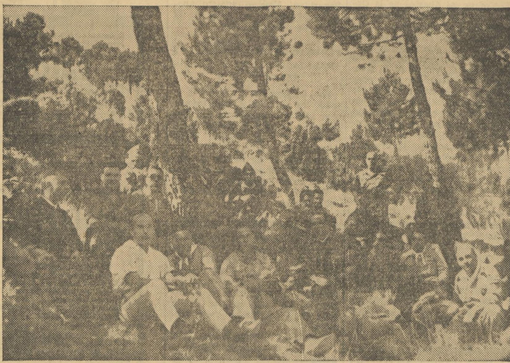
LA COMISION DE LA DIPUTACION DESCANSANDO EN SU VISITA AL FRENTE DE VILLEL