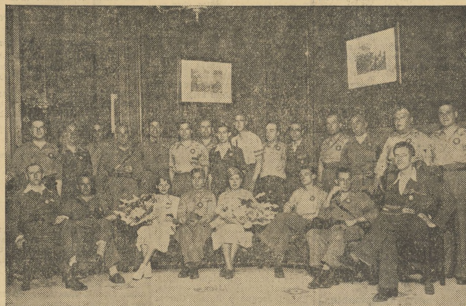
COMITÉ DE LA GUARDIA NACIONAL REPUBLICANA EN VALENCIA

Y hubo malestar en el pueblo y hubo inquietud, desasosiego entre aquellos guardias que, siendo fieles al Régimen, sentían todo el