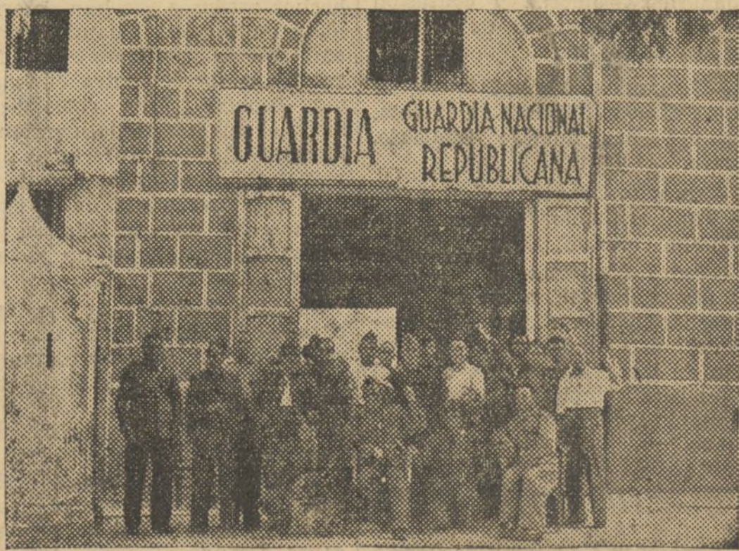
Puerta principal del cuartel de Arrancapinos