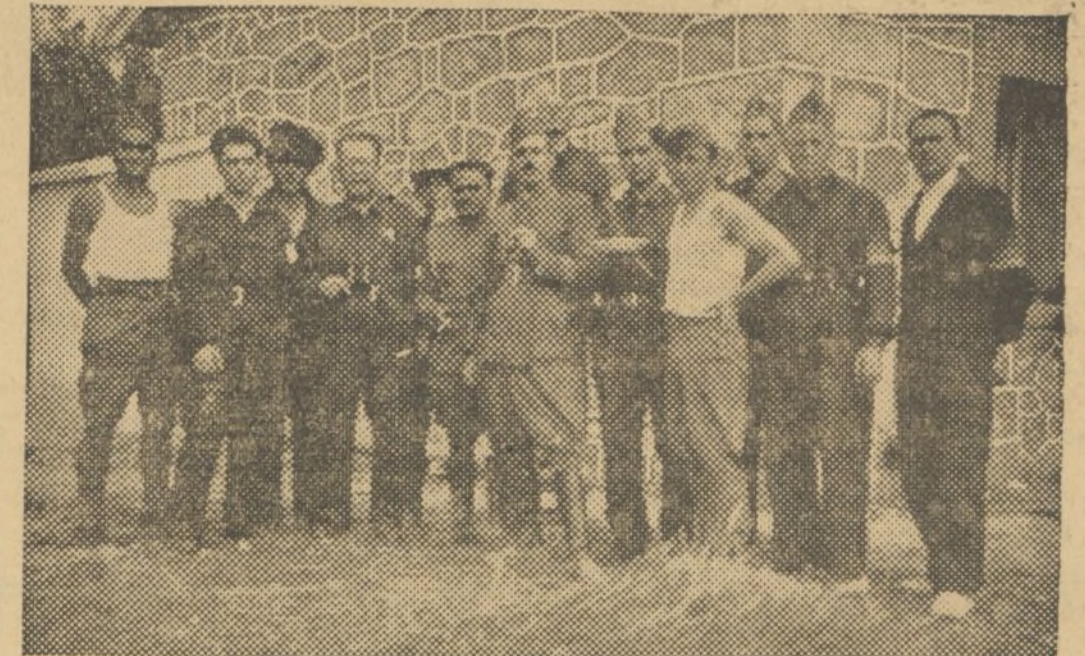
EN ENTUSIASTA CAMARADERIA, EJERCITO, MILICIAS Y SANITARIOS VALENCIANOS COADYUVAN ENTUSIASTAS POR EL TRIUNFO

Toda la correspondencia a EL PUEBLO, debe dirigirse al Apartado de Correos número 338