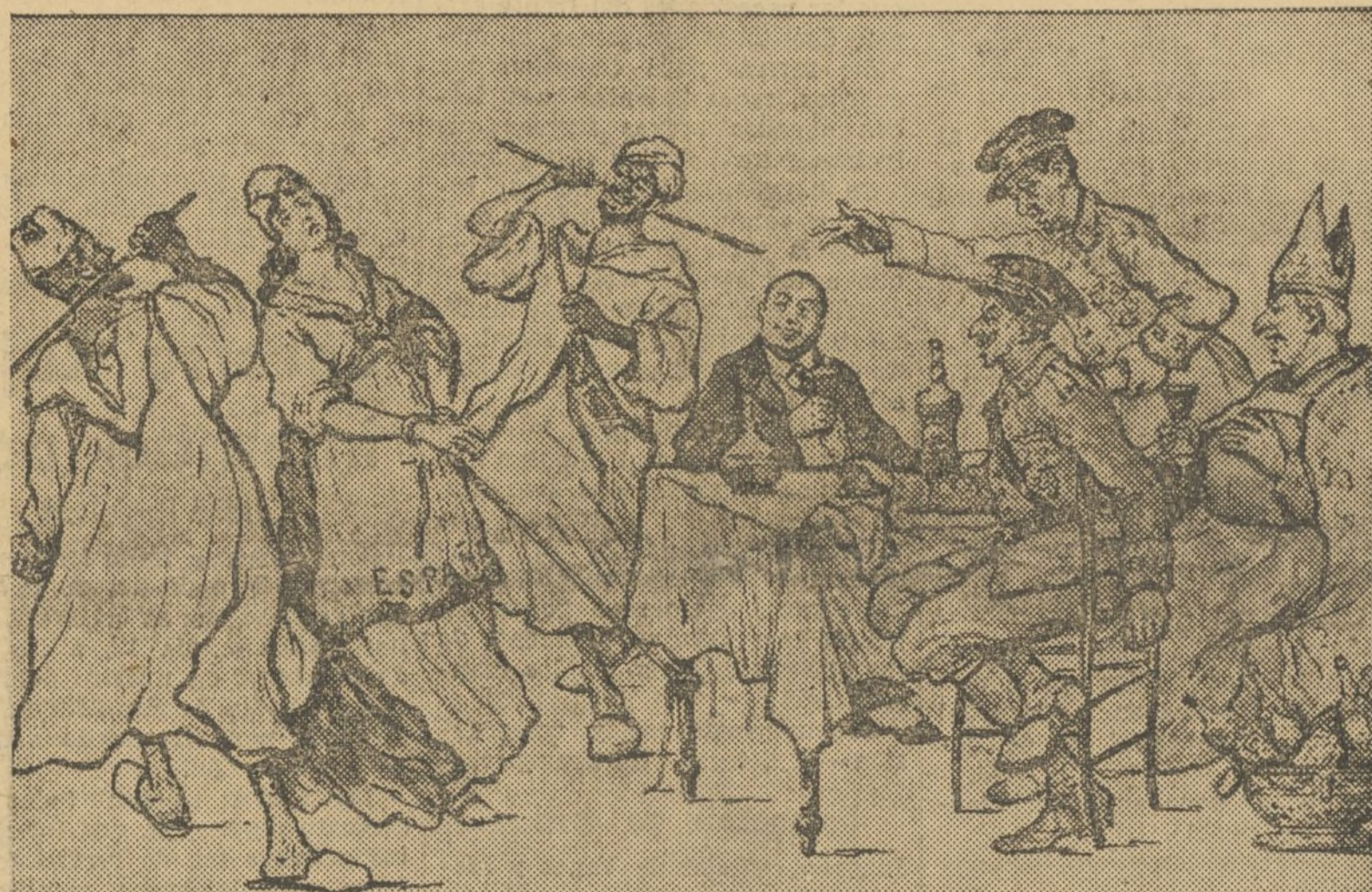
REFINAMIENTO EROTICO DE LOS COMPADRES FASCISTAS AL SON DE «LA MARCHA DE CADIZ»