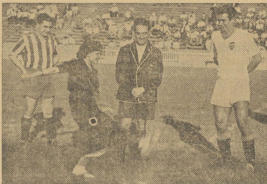
UNA BELLA MILICIANA LANZANDO EL KIK-KOFF DE SALIDA EN EL PARTIDO JUGADO EN MESTALLA, EN HOMENAJE Y BENEFICIO DE LOS MILICIANOS

ya impuesto por completo, arrojó a su contrincante, que «encajó» cinco tantos más. El Athletic no pudo batir a Antolin ni inquietar seriamente a las líneas defensivas de los valencianos. Es-