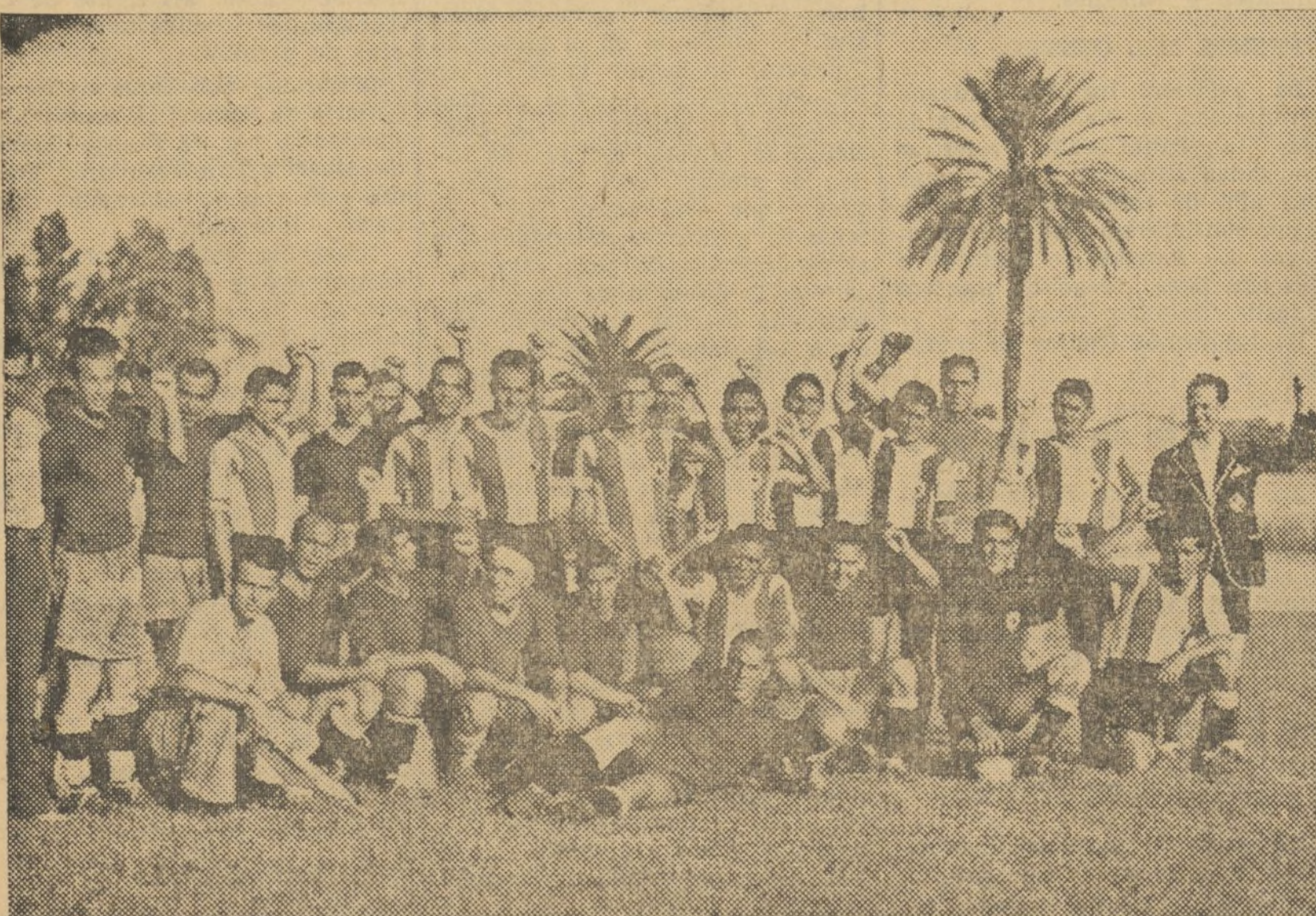
ANTES DEL ENCUENTRO ENTRE EL HERCULES Y EL LEVANTE, LOS EQUIPOS EN FRANCA CAMARADERIA

En los terrenos del Camino Viejo del Grao contendieron el domingo, por la tarde, los primeros equipos del Levante y del Hércules de Alicante.