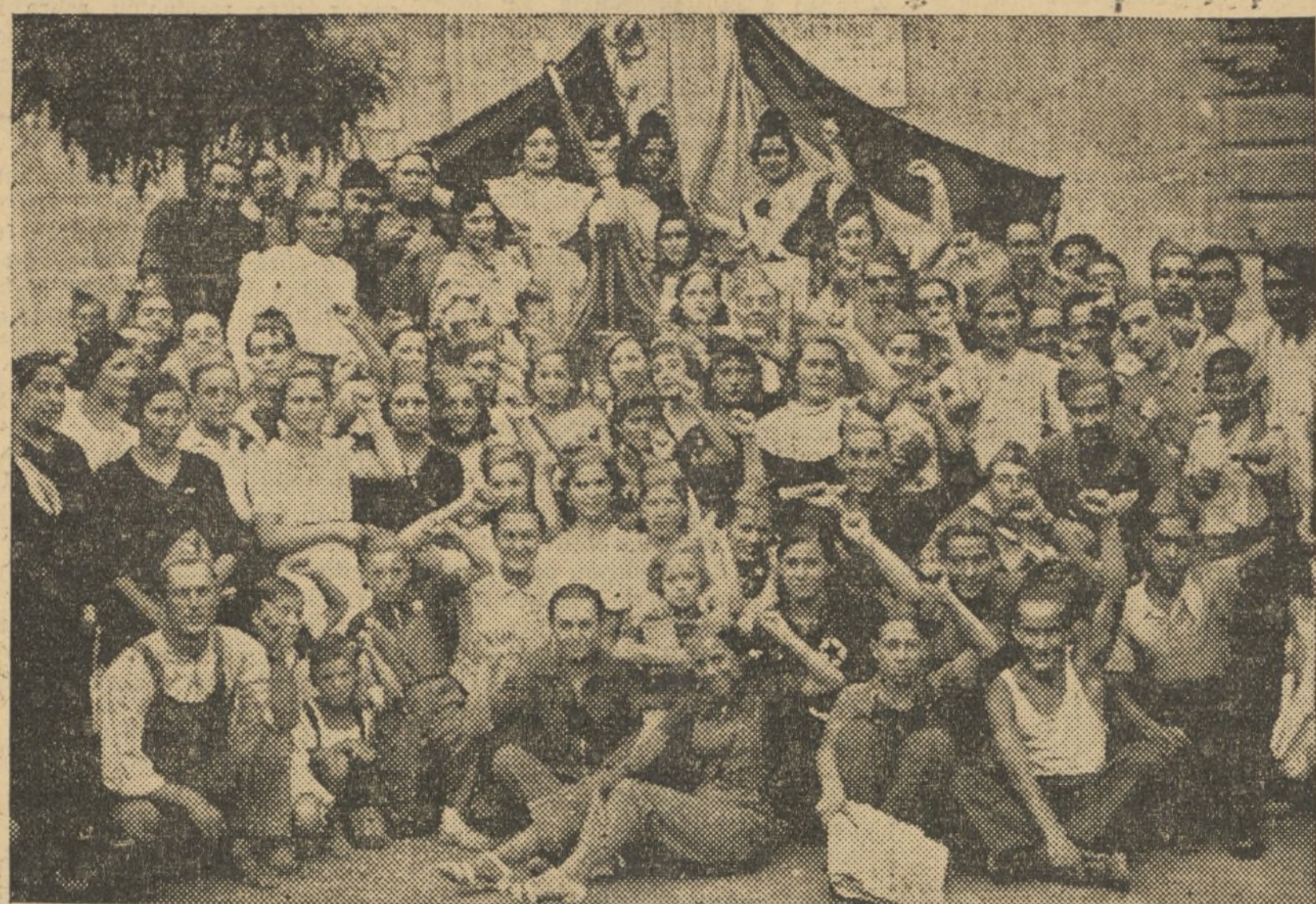
EN LA GUARDERIA OLORIZ SE HA REPARTIDO ENTRE LOS HIJOS DE LOS MILICIANOS, CUYOS PADRES LUCHAN EN LOS DIVERSOS FRENTE, ENORME CANTIDAD DE JUGUETES PRODUCTO DE DONATIVOS DE OTROS NIÑOS

Esta administrativa cree un deber el invitar a todos los compañeros pertenecientes al ramo de la madera y a todos los trabajadores en general, para que hoy, a las cuatro de la tarde, asistáis como un solo hombre a la conducción de sus restos, partiendo del Sindicato de la Madera, plaza de San Andrés, 3. — La administrativa.