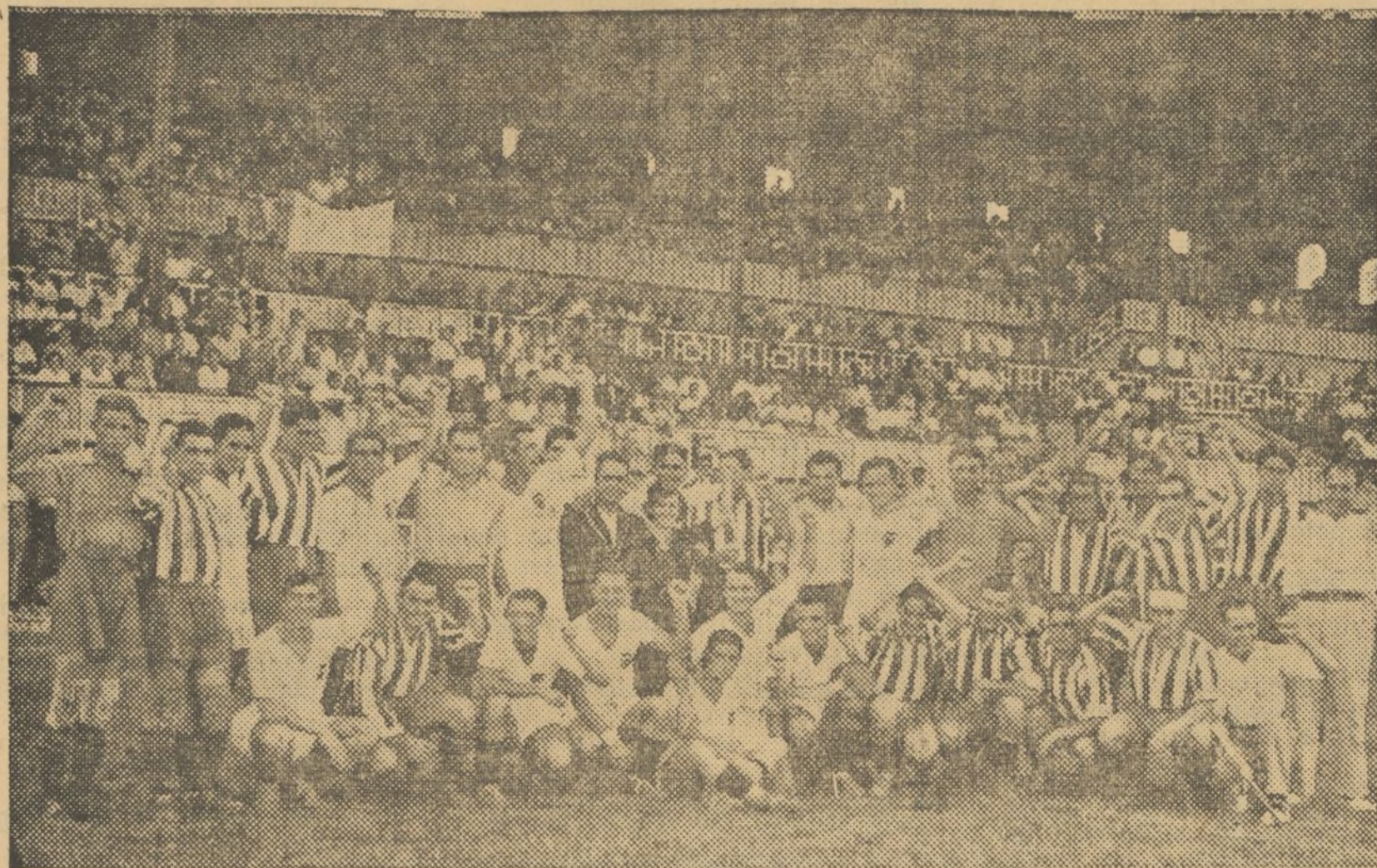
LOS EQUIPOS DEL VALENCIA Y DEL ATHLETIC DE MADRID, MOMENTOS ANTES DEL PARTIDO A BENEFICIO DE LAS MILICIAS

El match estaba organizado a beneficio de los huérfanos de milicianos, por la J. I. R. Pese a sus esfuerzos, no pudieron desplazarse los jugadores que habían anunciado y claró está, la superioridad del grupo valenciano fué evidenciada. De todas formas, el acto resultó brillante y puso de manifiesto la estrecha unión de los valencianos con la causa antifascista, contribuyendo a la menor llamada con su presencia y su ayuda económica y moral.