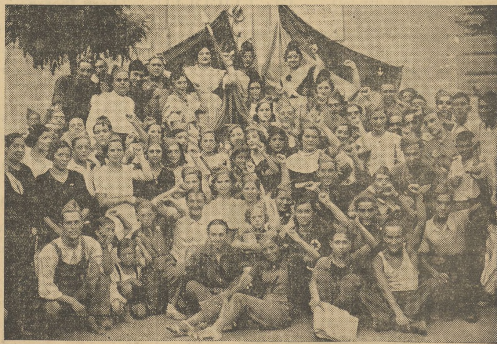
GRUPO DE SEÑORITAS DE LAS COMISIONES DE LAS FALLAS CUENCAS-ALCIRA Y CERVANTES. PADRE JOFRE, QUE HAN SALIDO A POSTULAR POR LAS CALLES DE VALENCIA, A BENEFICIO DE LAS MILICIAS VOLUNTARIAS ORGANIZADO POR LA ISLA FALLERA

Esta medida, que se toma por falta de medios de alojamiento, debe ser observada por todos, facilitando nuestra labor. — El Comité.