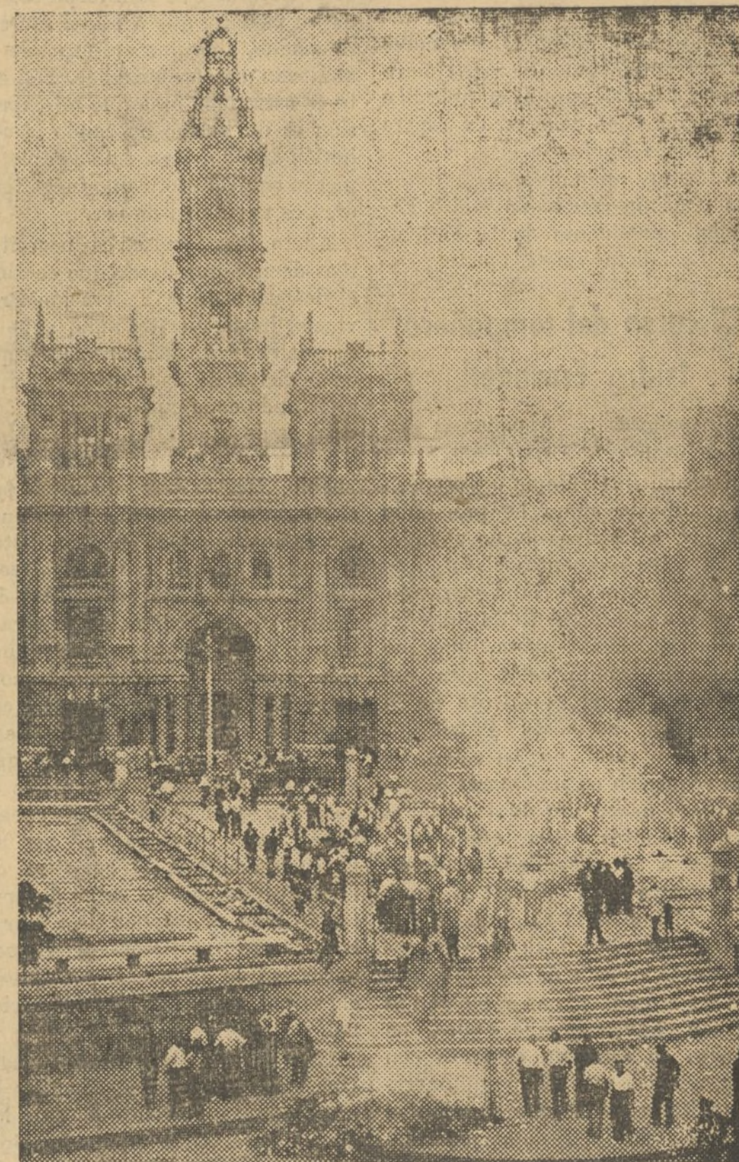
EN LA PLAZA EMILIO CASTELAR, EL PUEBLO PRENDE FUEGO A UN FICHERO QUE LOS FACCIOSOS HABIAN CONFECCIONADO CONTRA LOS HOMBRES MAS SIGNIFICADOS DE IZQUIERDA. ESTE FICHERO HA SIDO ENCONTRADO EN EL GOBIERNO CIVIL