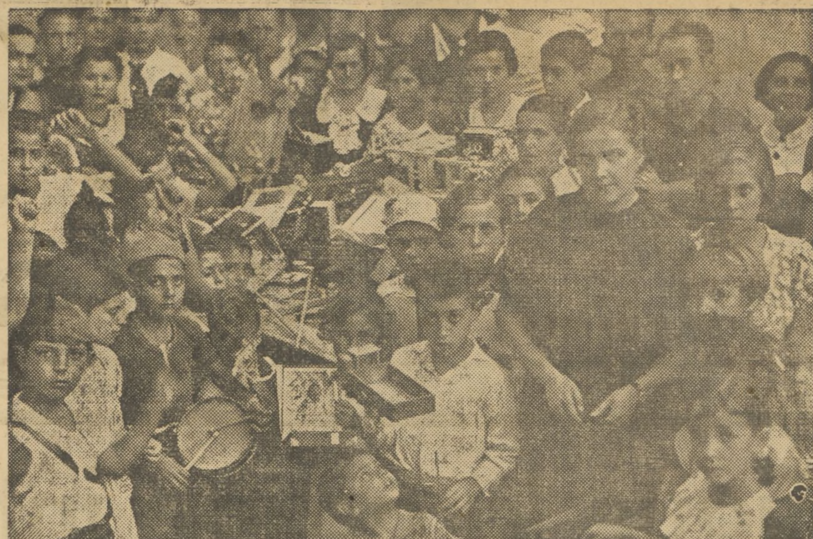
EN LA GUARDERIA OLORIZ SE HA REPARTIDO ENTRE LOS HIJOS DE LOS MILICIANOS, CUYOS PADRES LUCHAN EN LOS DIVERSOS FRENTES, ENORME CANTIDAD DE JUGUETES PRODUCTO DE DONATIVOS DE OTROS NISOS

Todos los camaradas músicos de Valencia y su provincia afiliados o simpatizantes a este Partido de Esquerra Valenciana que deseen formar parte de la banda de música, pueden pasar por estas oficinas, calle de Lauria, 2, para su inscripción y al mismo tiempo enterarse de las condiciones.