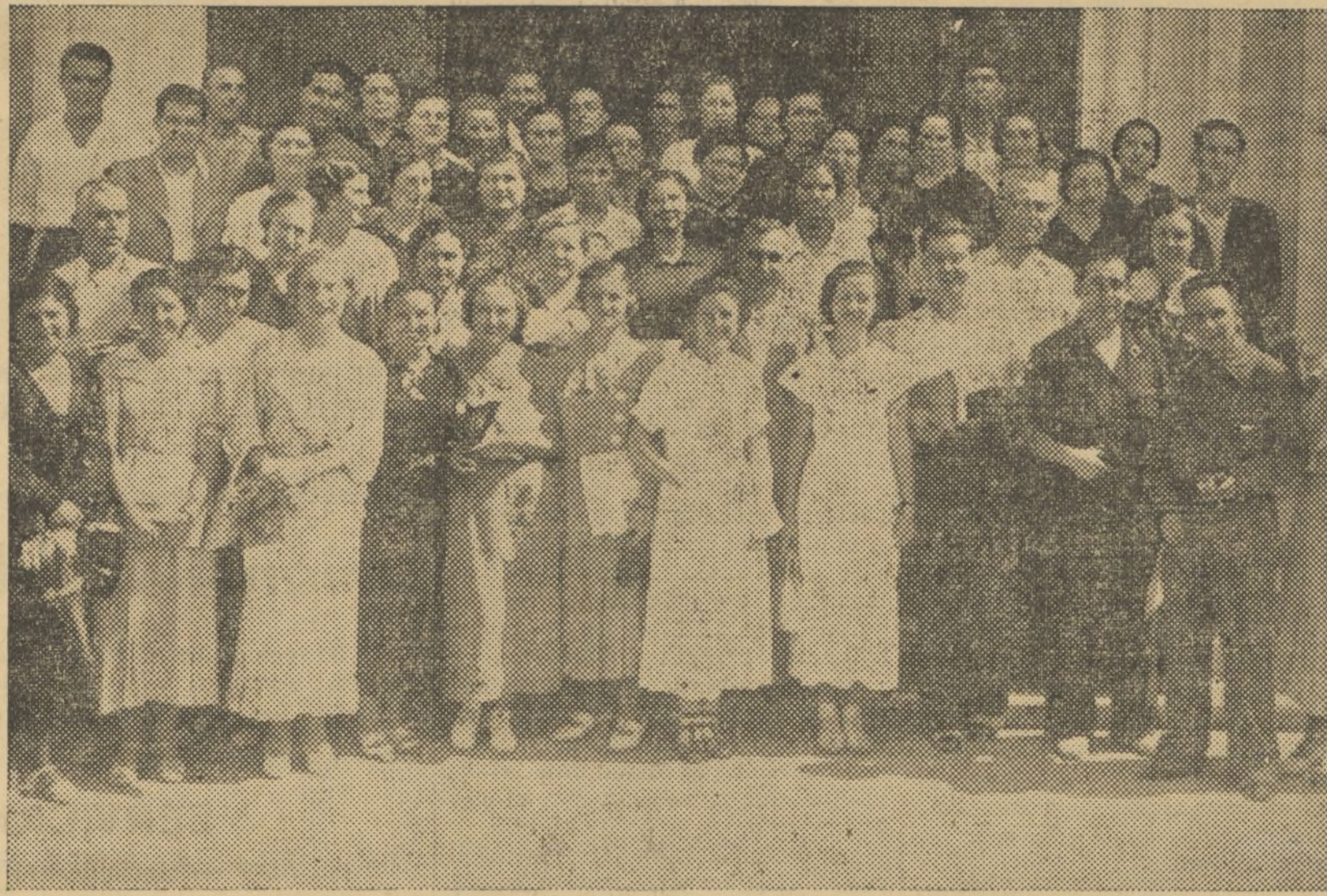
MAESTROS Y MAESTRAS NACIONALES QUE HAN TERMINADO UN CURSILLO DE «ENFERMEROS DIPLOMADOS» PARA SALIR AL FRENTE A PRESTAR SUS VALIOSOS SERVICIOS COMO TALENTOS

Enviamos nuestros saludos calorosos de solidaridad fraternal a las mujeres españolas, valientes y resueltas. ¡Vivan las mujeres laboriosas de España, que luchan al lado de sus maridos, padres, hermanos e hijos, contra el fascismo! ¡Viva su victoria sobre el fascismo! ¡Viva la República española, democrática, libre y su Gobierno!»