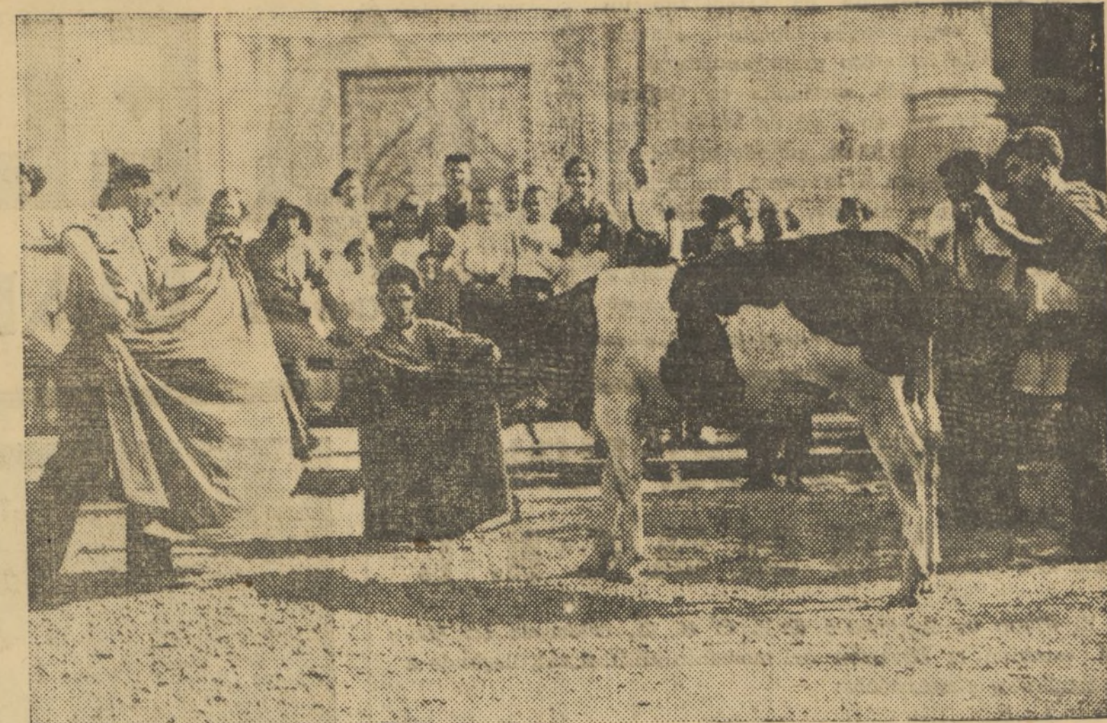
UN MOMENTO DE DESCANSO ES APROVECHADO POR LOS MILICIANOS PARA LUCIR SUS APTITUDES TAUROMACAS Y DISTRAER A LOS PEQUEÑOS ASILADOS DEL COLEGIO DE SAN JOSE

Pasado mañana domingo, a las cuatro y media de la tarde: Se-