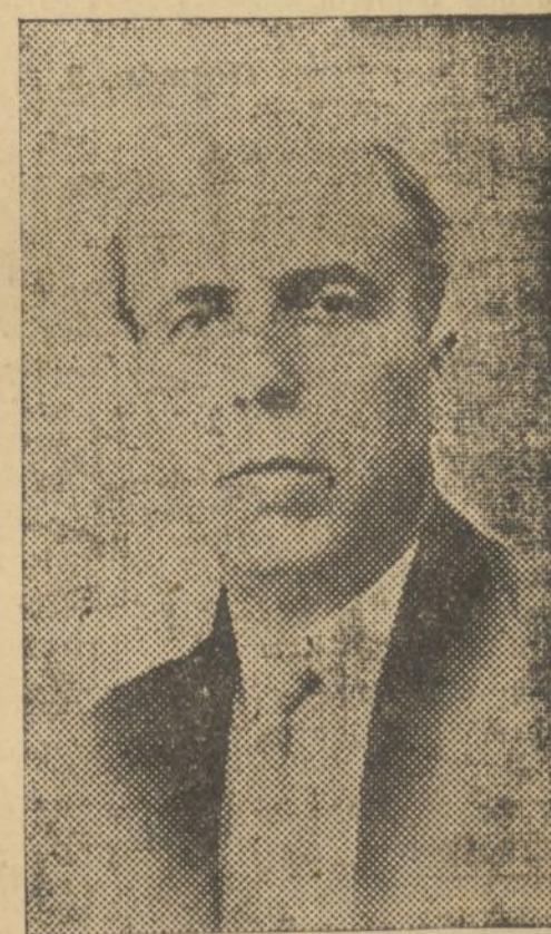
JULIO JUST GIMENO que ha sido nombrado ministro de Obras públicas en el actual Gobierno