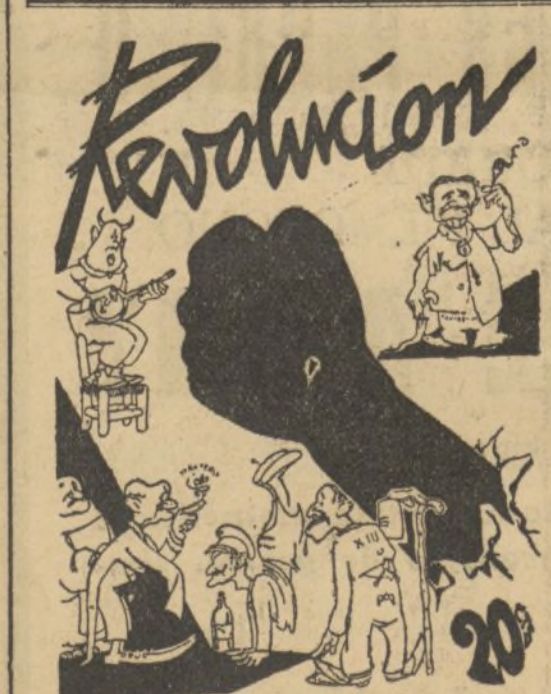
Portada del primer número del semanario «Revolución», que acaba de aparecer