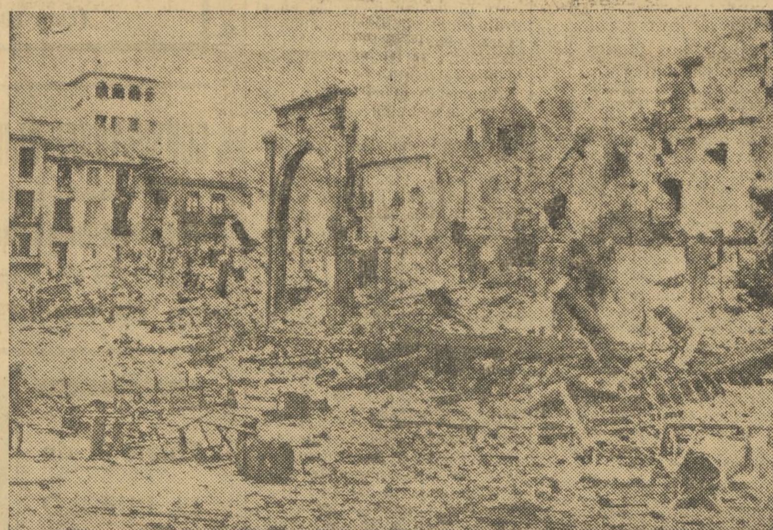
HE AQUI UNA VISTA DE TOLEDO. — LA PLAZA DE ZOCODOVER, DESDE LA FAMOSA POSADA DE LA SANGRE, Y LO QUE QUEDA DEL ALCÁZAR, DONDE ESTA REFUGIADO EL TRAIDOR MOSCARDO

Inmediatamente se dió lectura de la misma al Jurado, preguntándole si procedía la conmutación, respondiendo que no.