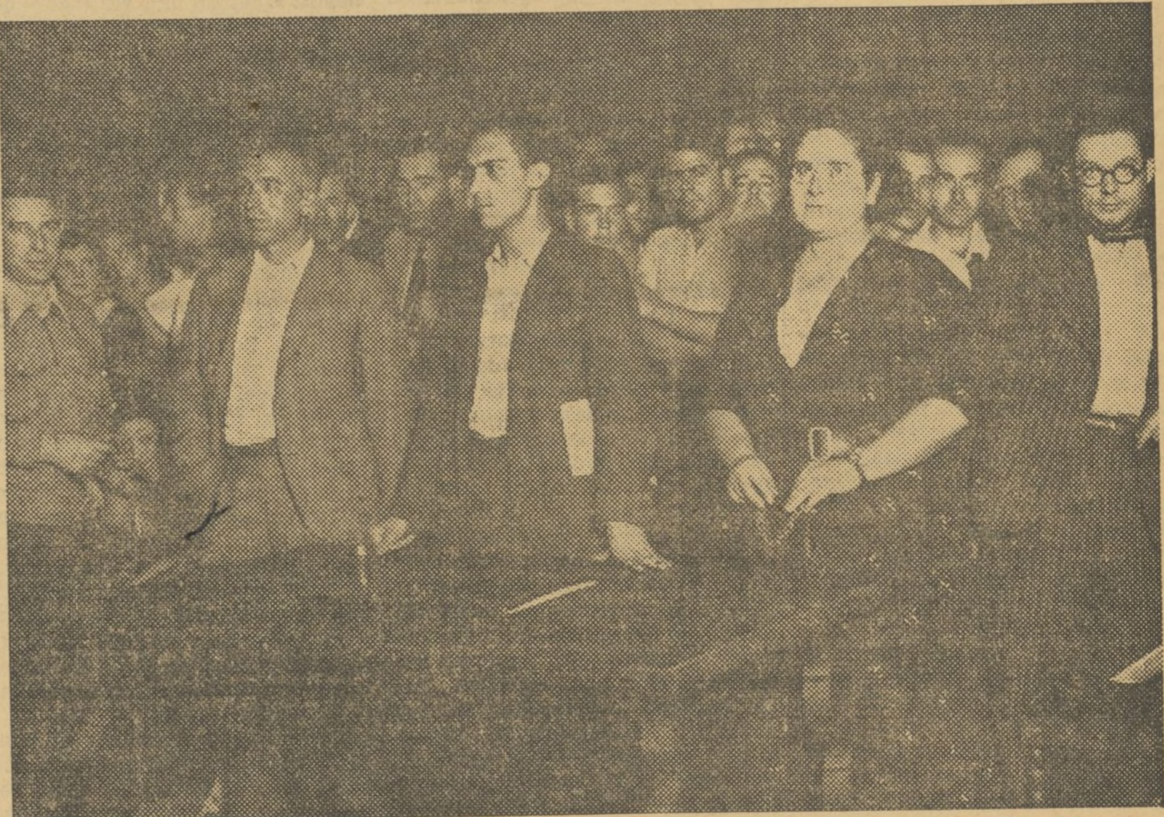
FEDERICA MONSENY, JUNTO CON LOS ORADORES QUE TOMARON PARTE EN EL MITIN DEL TEATRO PRINCIPAL, ORGANIZADO POR LA CONFEDERACION REGIONAL DEL TRABAJO DE LEVANTE

contribuido a crear esta situación de desastre en España; pero hemos recogido el guante, hemos aceptado el desafío y lo mismo en Valencia, que en Cataluña y que en Extremadura, la C. N. T., ha