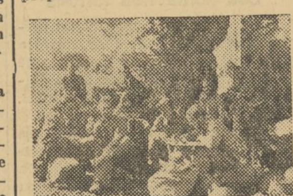
Después del aseo en nuestro campamento de Campillo, un miliciano escribe a los suyos mientras otro cura al compañero la rozadura de un pie

Me dice pertenecía a la C. N. T. y que le cogieron en su pueblo a la fuerza, uniformándole como del tercio y alistándole en la bandera de Sanjurjo. A casi todos los que componen esta bandera se les reclutó por análogo procedimiento. Les han traído aquí desde Zaragoza y él, como muchos, ha estado desde el primer día esperando una oportunidad para pasarse. Sabe que de no estar tan vigilados, se pasaría a nosotros; pero el no dejarnos hablar a cuatro juntos — bajo pena de muerte — y el temor que les domina ante la falta de contacto, impide que realicen su propósito.