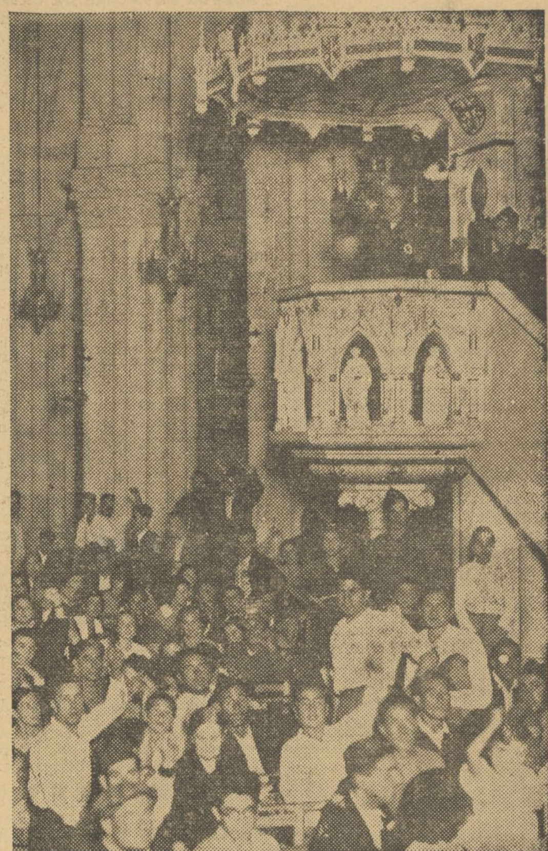
ISIDRO ESCANDELL, DIPUTADO SOCIALISTA POR VALENCIA, DURANTE SU DISCURSO EN LA EX IGLESIA DE LOS DOMINICOS, ACTO ORGANIZADO POR LA ALIANZA DE INTELECTUALES DE LA DEFENSA DE LA CULTURA Y LA F. U. E.