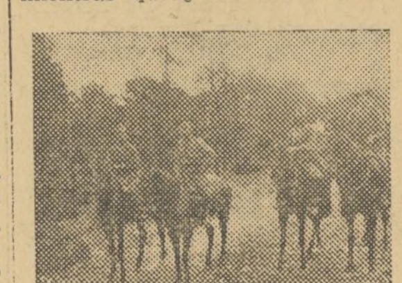
Un servicio de descubierta de nuestra caballería entre los pinares de Campillo

radore en Valencia y colabora activamente como agregado al parque móvil de Bezas. Me dice que mientras quede un solo fascista