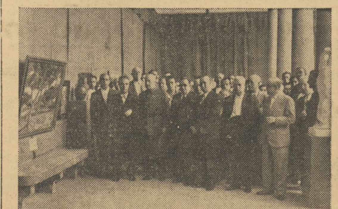
LAS AUTORIDADES DE VALENCIA INAUGURANDO LA EXPOSICIÓN DE BELLAS ARTES, A BENEFICIO DE LAS MILICIAS

Se accedió a su ruego y se les entregó la pieza de artillería, que situaron en el lugar donde decían ser más adecuado para causar quebranto a los insurrectos, y, efectivamente, a los tres disparos una granada voló un polvorín de los facciosos.