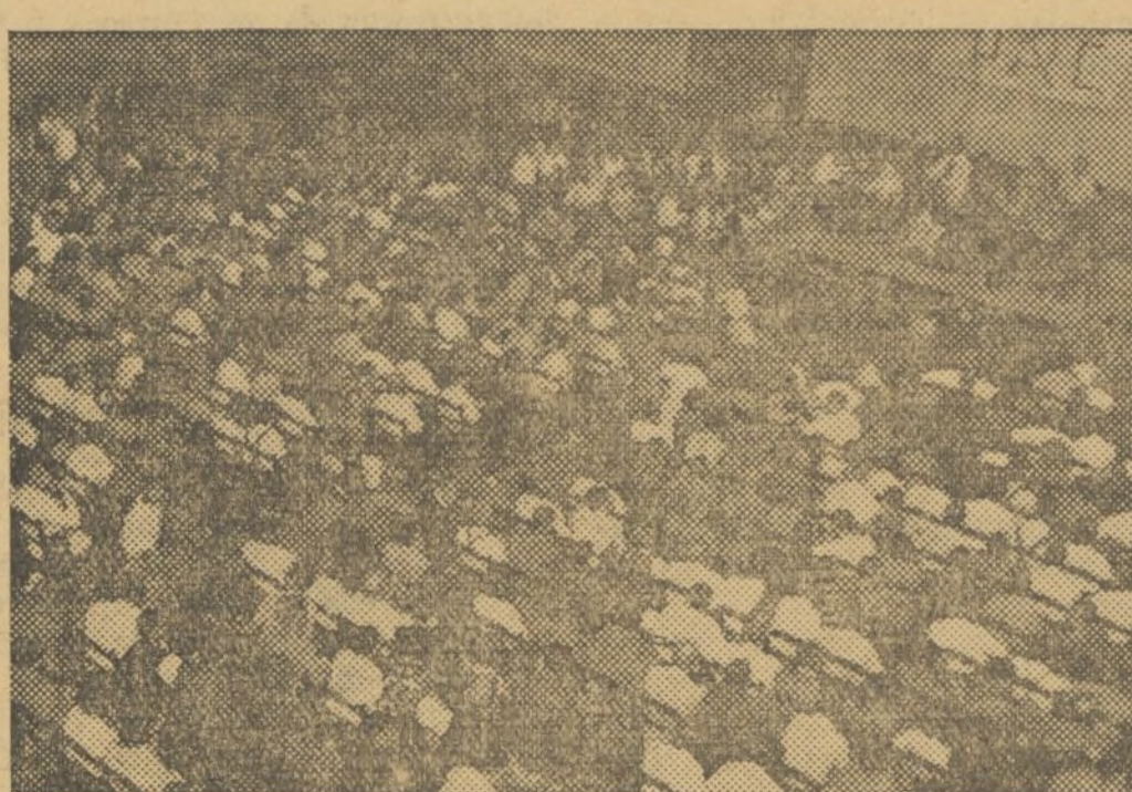
UNA VISTA DEL CINE COLISEUM DURANTE EL GRAN MITIN DEL PARTIDO COMUNISTA