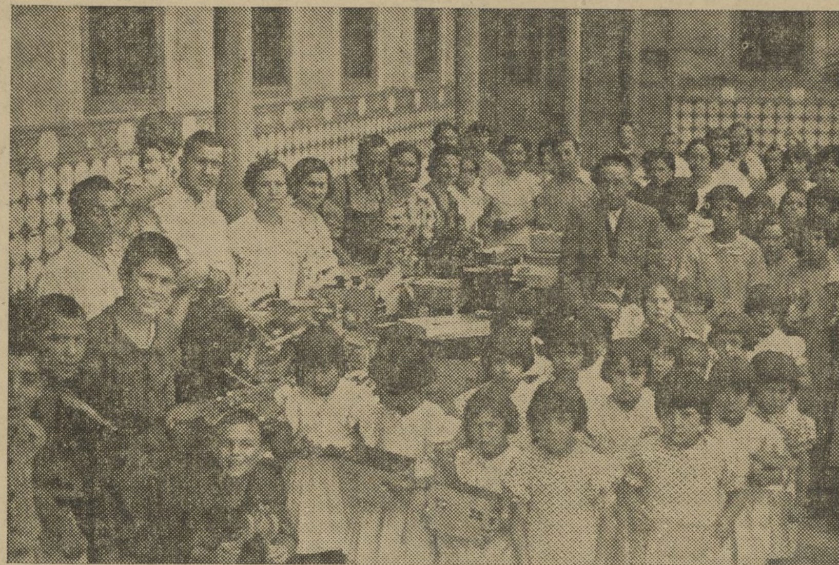
EL SINDICATO PROVINCIAL DEL RAMO MADERA U. G. T. (SECCIÓN JUGUETES), QUE SE HA DISTINGUIDO POR SU ALTO ESPIRITU HUMANITARIO AL REPARTIR ENTRE LOS NIÑOS HUERFANOS E HIJOS DE MILICIANOS GRAN CANTIDAD DE JUGUETES

Frente Occidental de Teruel. Bezas-Campillo, Septiembre.