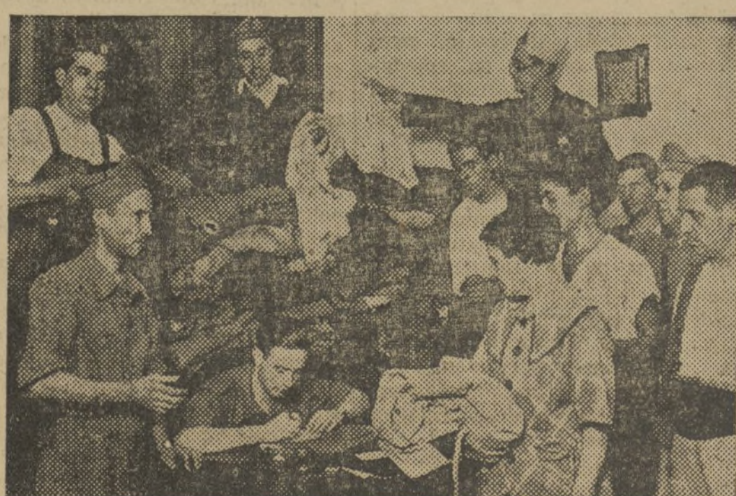
ANTE EL REQUERIMIENTO DEL COMITE DE DEFENSA, EL PUBLICO EN UNO DE LOS LOCALES ESTABLECIDOS ENTREGANDO TRINCHERAS E IMPERMEABLES, CON DESTINO A LOS BRAVOS MILICIANOS QUE LUCHAN EN EL FRENTE