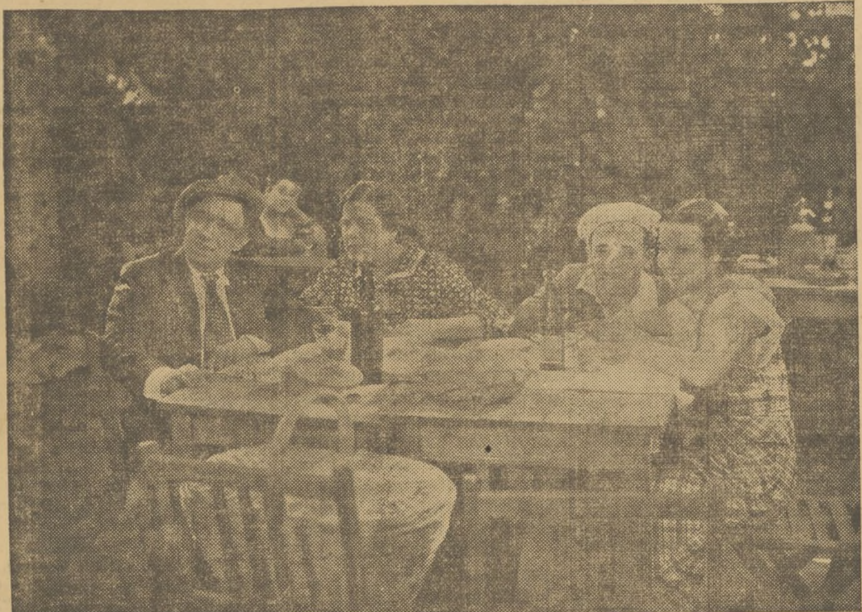
«LOS CLAVELES». EN LA PRADERA MADRILEÑA, AL ABRIGO DE SAN ANTONIO DE LA FLORIDA CUANDO YA SE HA HECHO LA PAZ

rán ante un micrófono instalado en el vestíbulo del Capitol. Después de los discursos han de ser breves. Hacemos esta advertencia porque sabemos que García Sánchez y dos o tres charlistas más pensaban asistir y de no hacerles esta advertencia los operadores iban a consumir con ellos