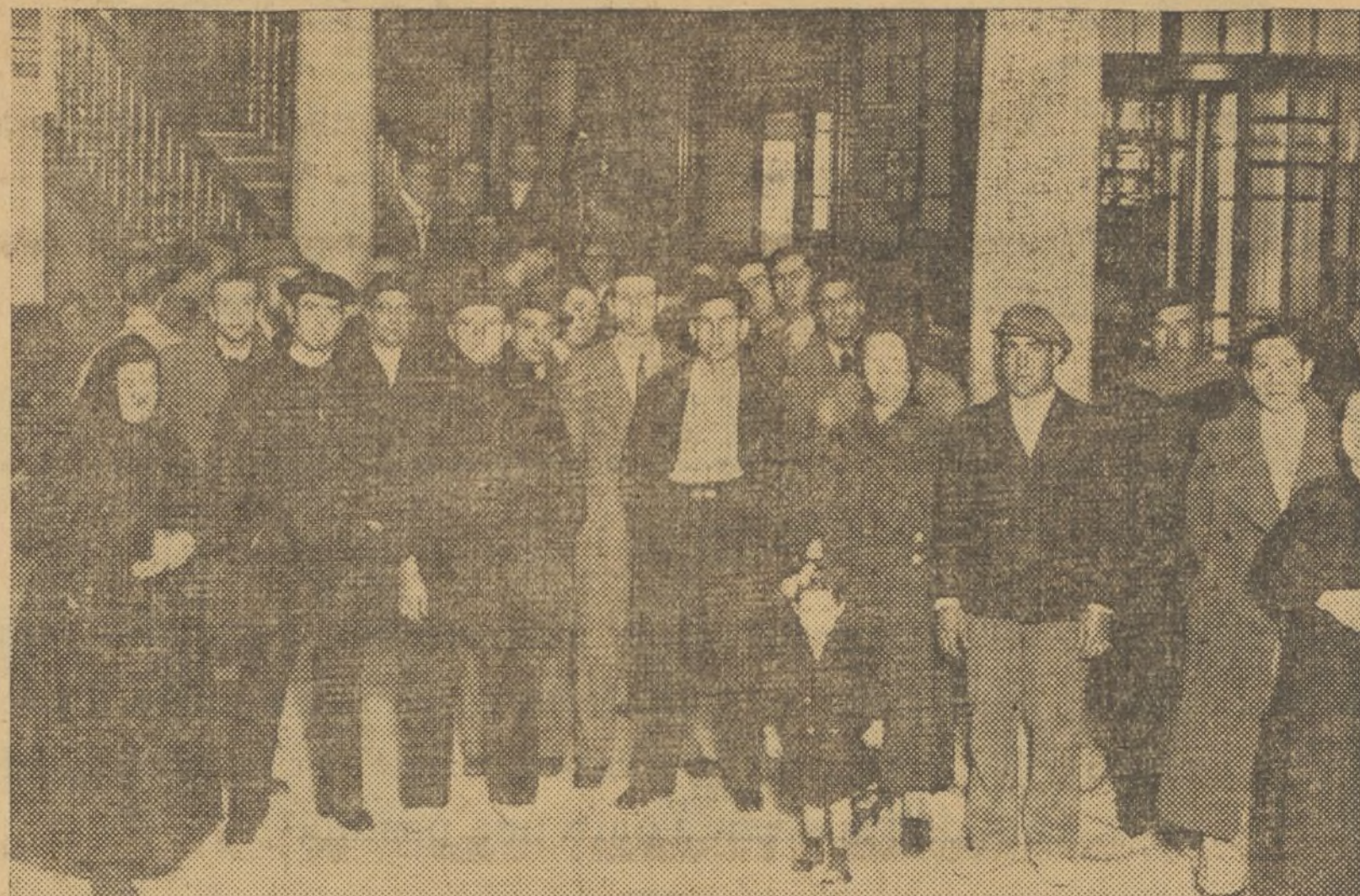
AFORTUNADOS VALENCIANOS COPARTICIPES DEL SEGUNDO PREMIO, REUNIDOS EN EL BANCO PARA COBRAR

Toda esta organización, social, financiera, higiénica, económica, jurídica y política les cuesta a las naciones que forman parte del ecuménico organismo ginebrino unos setenta y cinco millones de pesetas. Si gracias a él se llega finalmente al equilibrio internacional y a la sanidad de los males que afligen a muchos pueblos, el precio de tanto bien será realmente exiguo.