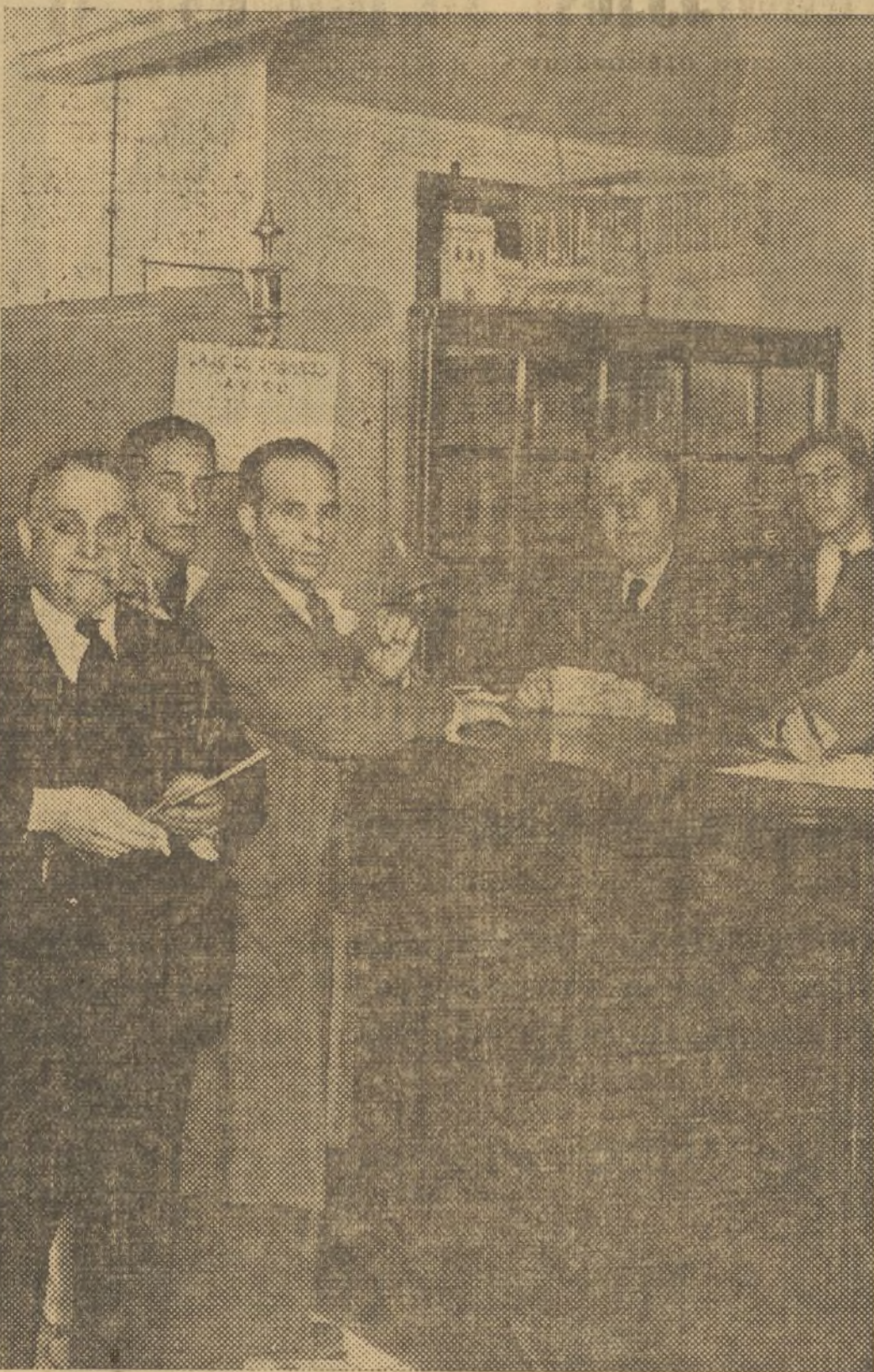
EL QUE ESTA COBRANDO DISFRUTARA DE 45.000 PESETAS QUE LE CONCEDIO EL NUMERO 18.103, SEGUNDO PREMIO DE NAVIDAD, PAGADO AYER