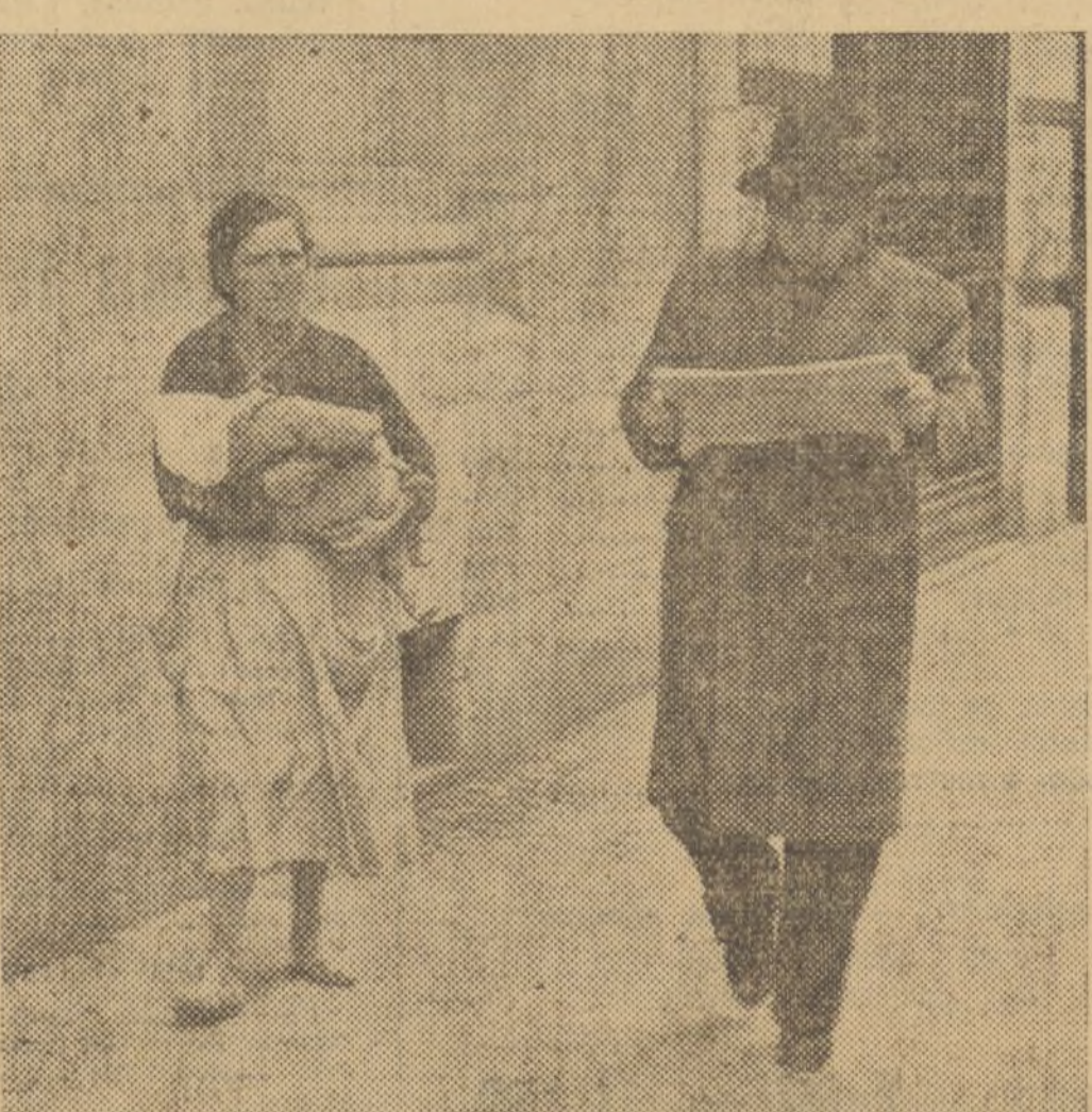
y en la calle, exhibiendo un niño, envuelto en harapos, la mendicidad profesional acocha al transeúnte

En toda gran ciudad y singularmente en las que, como la nuestra, tienen fama—y lo son—de ricas, existen actualmente tres