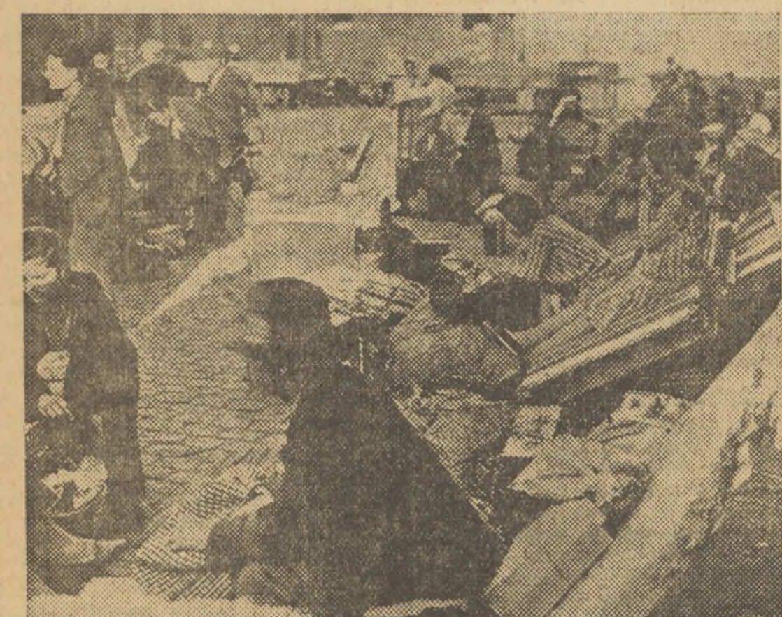
La emigración, cáncer social. La prole, azuzada por la miseria, corre en pos de aventuras... para malogradas las ilusiones de vida, hacinarse en las grandes urbes y en cualquier puerto un barco arroja su triste mercancía humana

de las gentes, un niño de dieciocho meses que aterido de hambre y frío tuvo que ser trasladado al Hospital provincial, donde se le hizo reaccionar convenientemente.