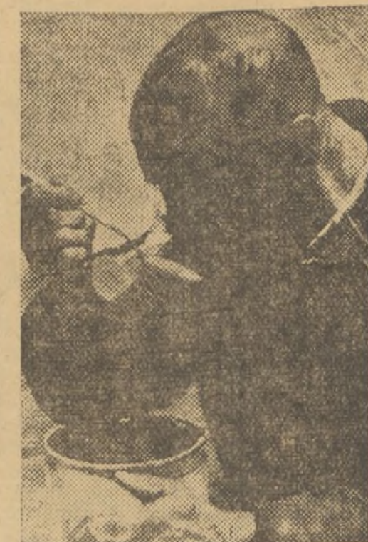
El ex campesino, ahora vagabundo, curtido por todas las inclemencias de la intemperie, allega a su estómago exhausto las sobras del rancho del cuartel

clases de mendigos: Primero: Los impedidos por un defecto físico para el trabajo, que tal vez pudieran ser reeducados y que hasta que a ellos llegue esta reeducación siguen una vida trágica, acudiendo muchos a ganar su existencia mediante una ocupación compatible con su estado. Segundo: Los que hacen profesión lucrativa de la mendicidad y resuelven el problema de su vida sin mayor trabajo que el deambulante por las calles situándose en sitios estratégicos, asediando a los transeúntes de mil formas y explotando a los niños: propios o ajenos—que hasta hubo de descubrirse una industria de alquiler de menores a estos efectos—y, finalmente, está la tercera clase: los que sanos y fuertes acechan el paso de señoras solas en calles solitarias y coaccionan cobardemente a sus víctimas; maleantes que tratan de justificar su condición de parásitos con el pretexto de «implorar» una limosna por falta de trabajo, sin que ni remotamente pasara jamás por su mente la idea de trabajar.