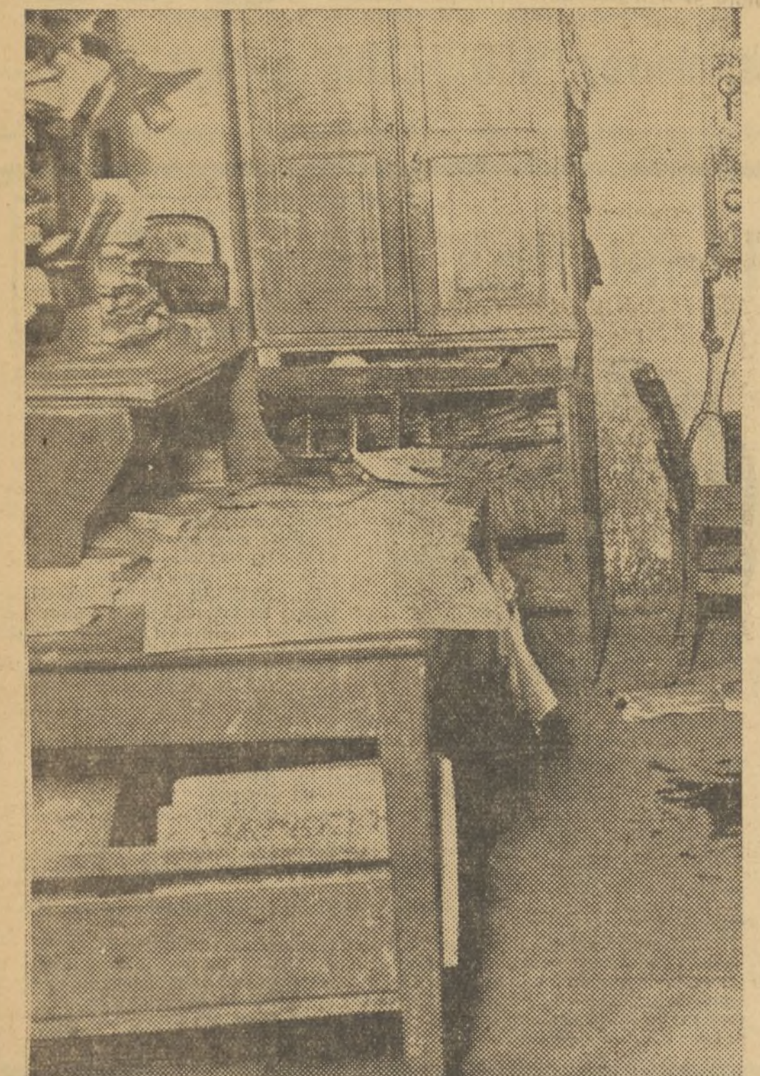
Interior del despacho del factor autorizado señor Cirujeda. En el primer término se ve la mesa que ocupaba el desgraciado factor cuando fué herido de muerte por los pistoleros

dismas de los agricultores y de los propietarios, víctimas de continuos robos de la gente maleante y por esto su vigilancia era extremada, singularmente los sábados y días primero y quince de cada mes, señalados para el pago de jornales o haberes a los obreros y empleados.