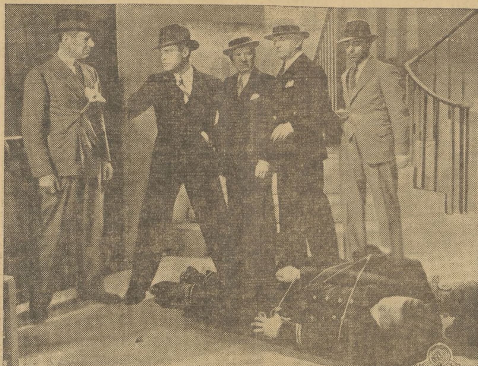
A la larga lista de soberbias películas que este año han desfilado por la pantalla de plata del magnífico y suntuoso cine Capitol, hay que añadir un nuevo título, EL HEROE PUBLICO NUM. 1. Un film verdaderamente alocacionador dedicado a los heroicos representantes de la ley