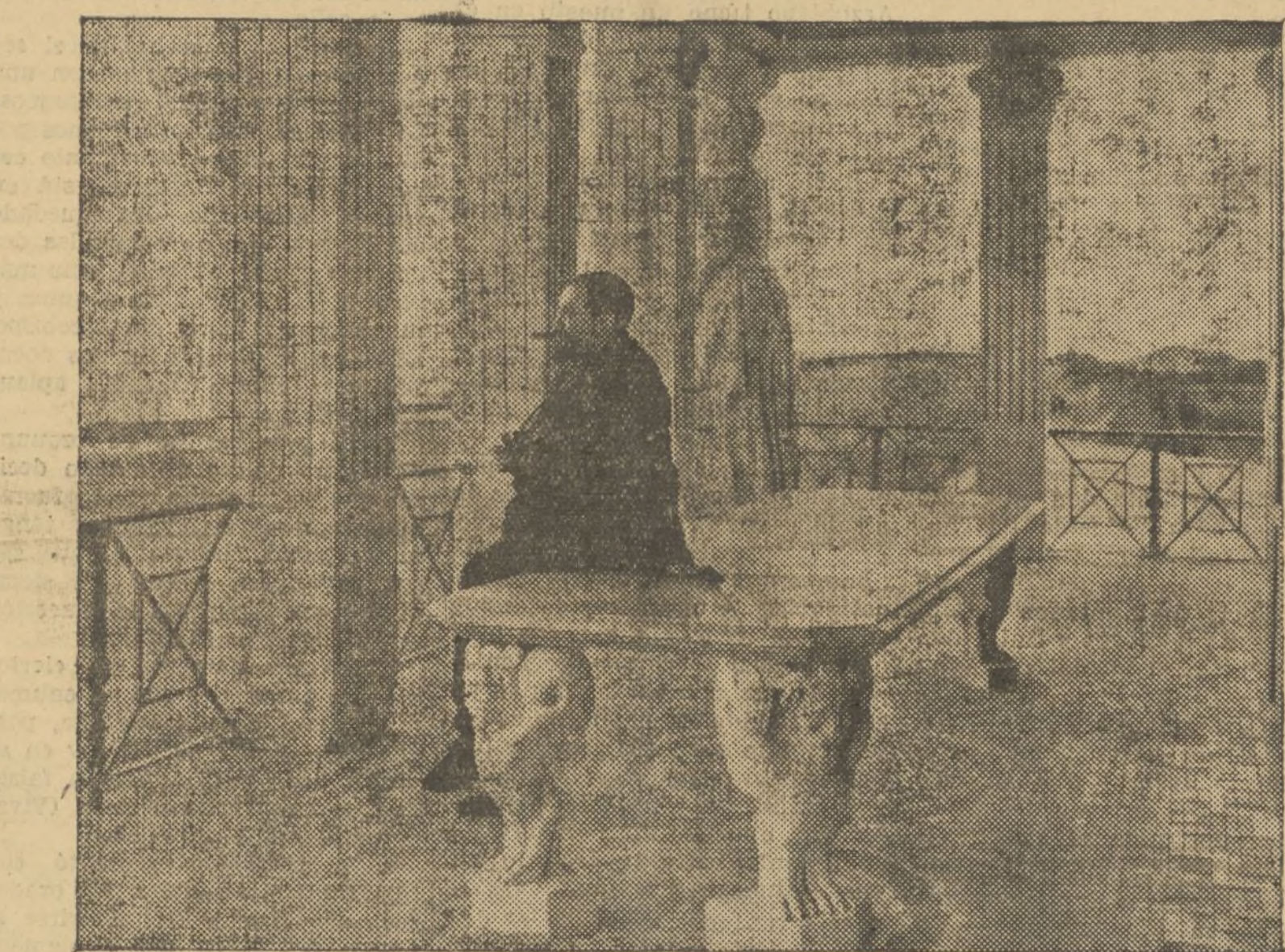
EL VALENCIANISIMO BLASCO IBAÑEZ, DE LAS BARBAS HEROICAS, EN LA TERRAZA DE SU CHALET DE LA MALVARROSA

Como la obra de tantos varones insignes depositada en el libro, años venideros podrán cubrirlos de pulvisculas de olvido. Una constante renovación del calor mismo de las palabras traza la cadena de los estilos y de las modas, que van dando paso a nuevas manifestaciones y formas de expresión. Lo que adquiere formas perdurables, más que lo escrito en los libros, es lo grabado en las almas. Estas