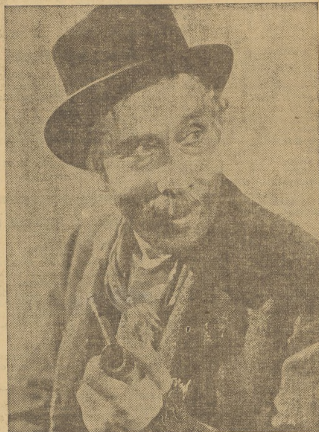
George Arliss en una nueva caracterización de Rostchild, de la película «El vagabundo millonario», (Foto Varsovia Film.)

Toda la correspondencia a EL PUEBLO , debe dirigirse al Apartado de Correo número 338