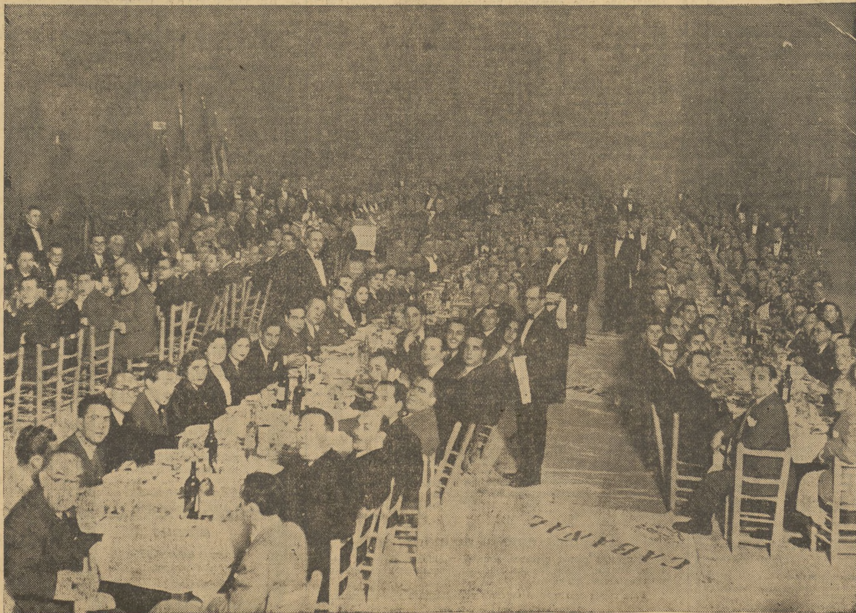
Perspectiva de una parte de los 450 comensales que asistieron al banquete

(Sigue esta información en la página sexta)