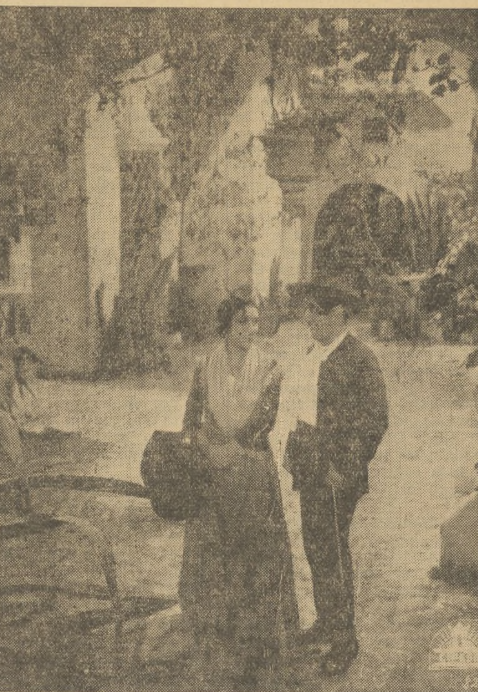
Imperio Argentina y Miguel Liger, en una escena de la nueva superproducción Cifesa «Morena Clara», que en breve se estrenará en Valencia