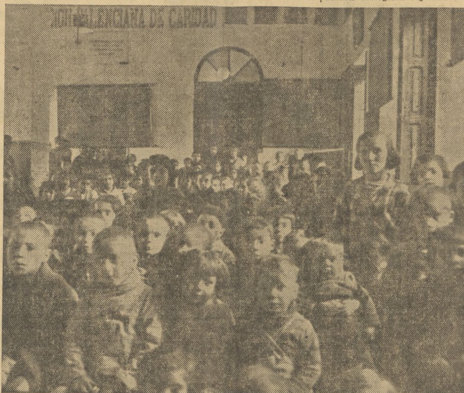
Ved los rostros de los niños que la Asociación Valenciana de Caridad tutela. Notad cómo rebosa en ellos la alegría y la satisfacción

A propuesta del señor Gisbert, fueron reelegidos los señores que