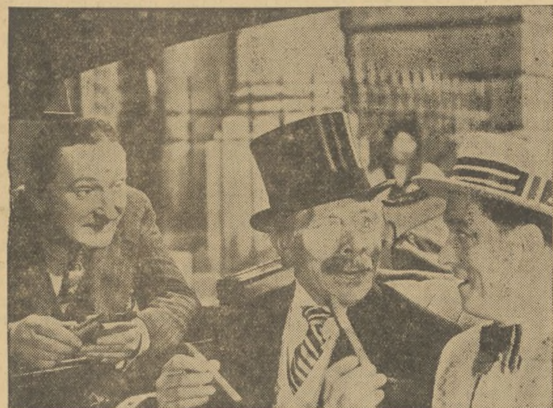
Una escena de la película "El vagabundo millonario", interpretada magistralmente por George Arliss, que se proyecta en Gran Teatro