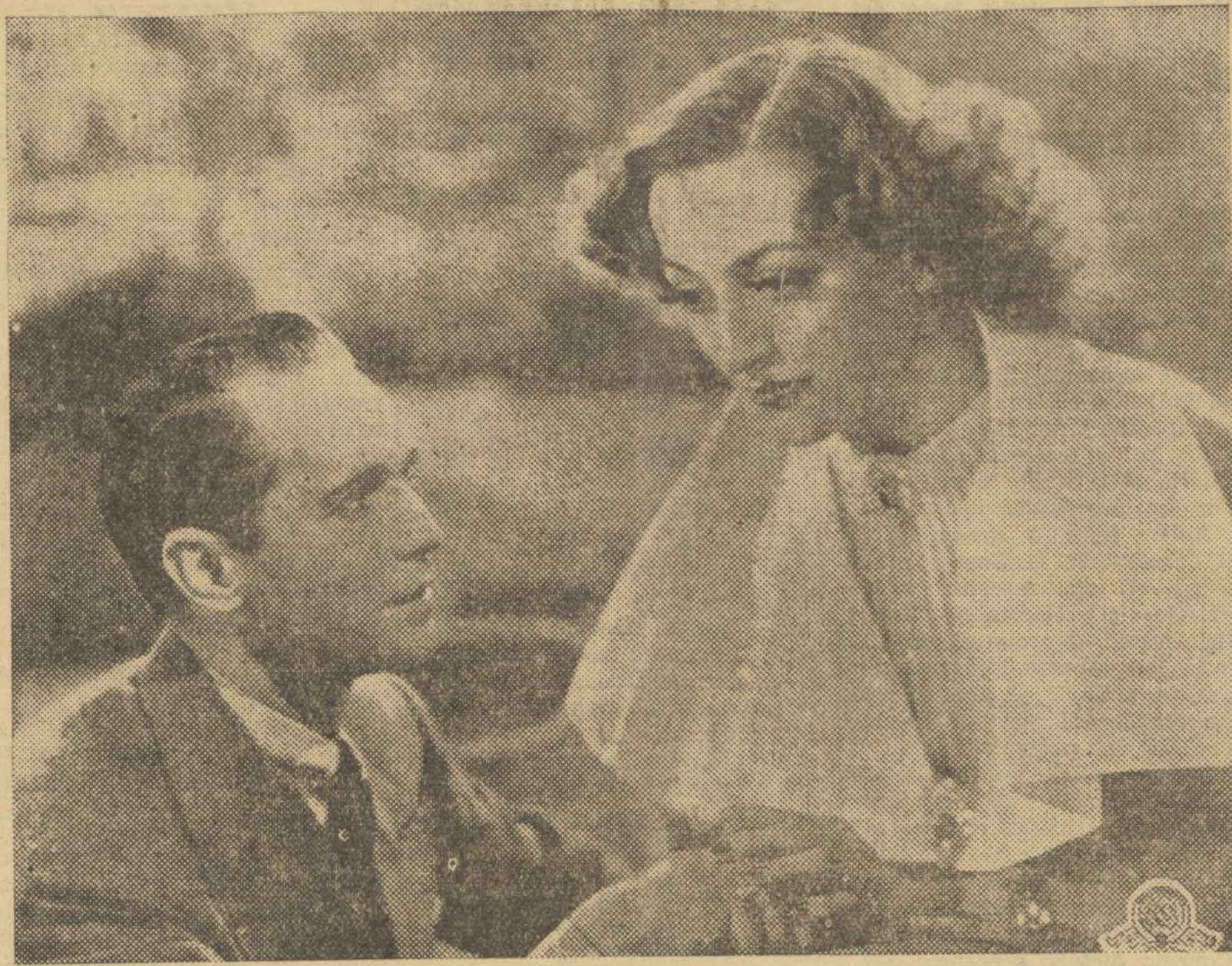
¡Vaya con el Capitol! ¡Y qué peli-cu-lita nos prepara para el lunes próximo! Nada menos que Joan Crawford y Franchot Tone, juntamente con Robert Montgomery, en "No más mujeres". Una deliciosa comedia elegida a pulso por la empresa del magnífico salón, para solaz y esparcimiento del público valenciano

Después se anuncia como cuarto film nacional, con los auspicios de Atlántic Films, el denominado "Nada sé de tí", que será rodado bajo la dirección de José Luis Sáez de Heredia.