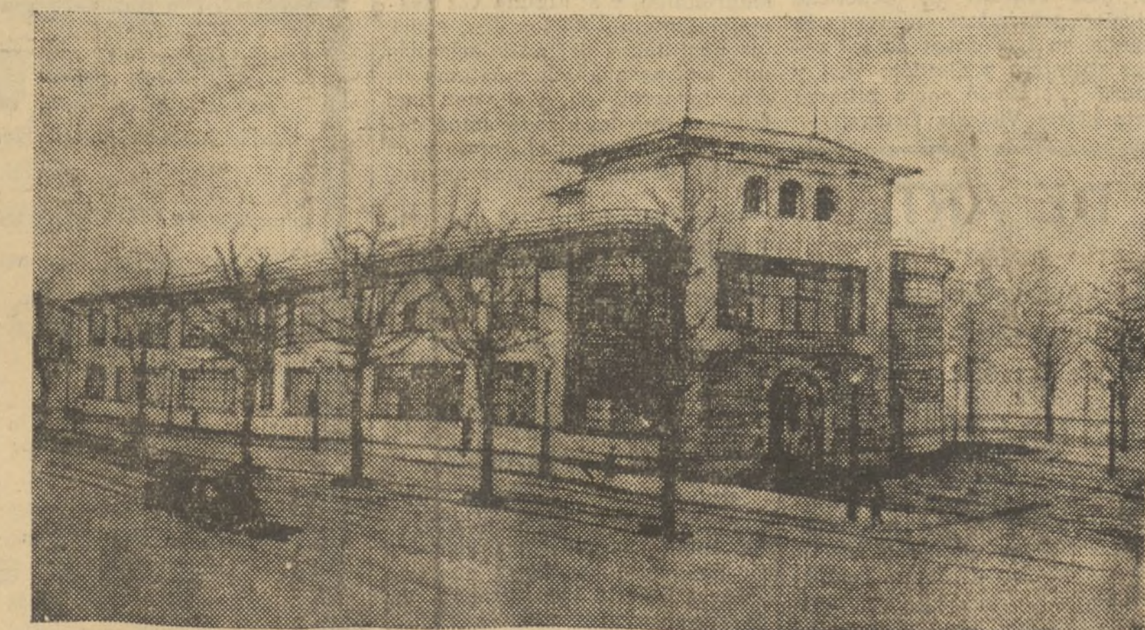
EL SOBERBIO RECINTO ESCOLAR VINATEA, QUE SERA LEVANTADO EN LOS JARDINES DEL LLANO DEL REMEDIO