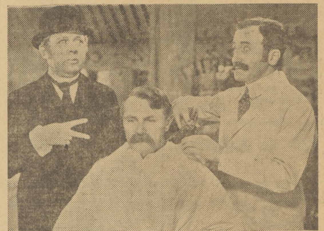
Una interesante escena de NOBLEZA OBLIGA. Film Paramount, que mañana estrena el suntuoso CAPITOL