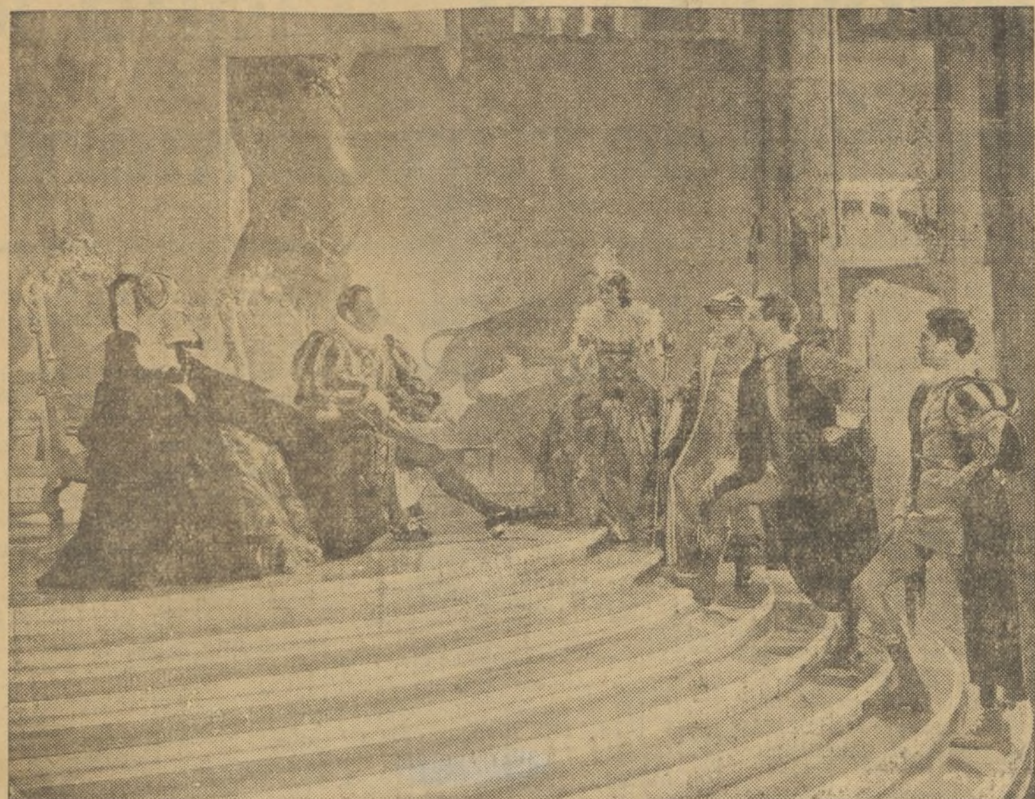
Una escena de la superproducción Warner Bros First National, «El sueño de una noche de verano», que muy pronto se estrenará en Valencia