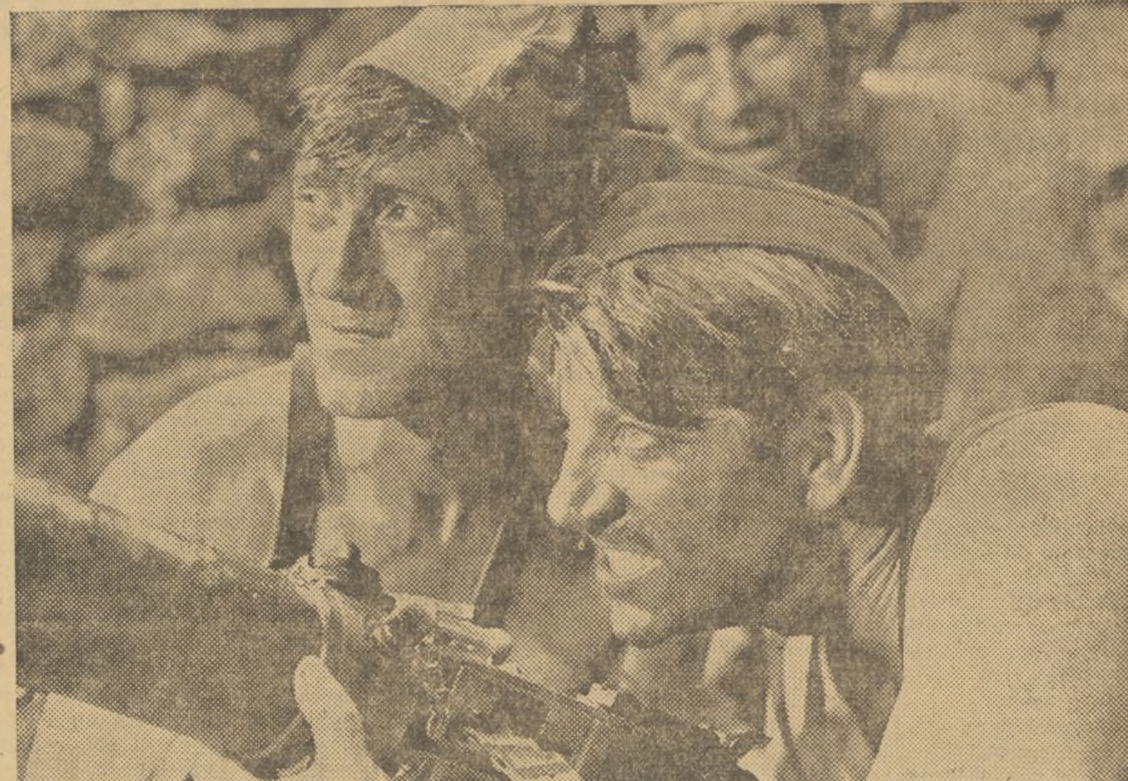
Una escena de la gran producción dedicada al ejército español, «La Kermesse Heroica», film dirigido por Du-vivier y protagonizado por Annabella y Jean Gabin, que el lunes próximo nos dará a conocer el sumptuoso cinema Capitol

No se puede pedir más gracia y mayor ironía que la que se produce al llegar un ayuda de cámara inglés a América con el único y exclusivo objeto de poder lograr la aristocracia de ademanes y actitudes en un acaudalado y simpático millonario que todo lo hace a la pata la llana, sin preocuparse de jerarquías sociales. Y todo ello conseguido de un modo magistral, gracias a las aptitudes histriónicas de Charles Laughthon, el famosísimo intérprete de «La vida privada de Enrique VIII» y de otras más, que se nos muestra