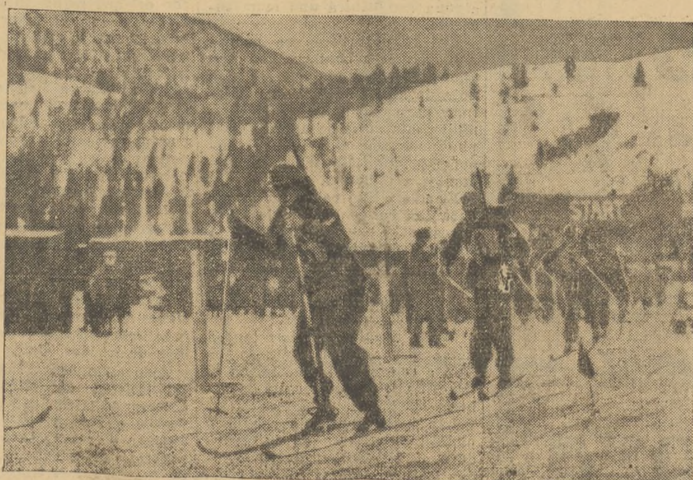
En la jornada militar de la Olimpiada han vencido los italianos en la prueba de patrullas, no sólo por ser buenos esquiadores, sino por sus tiros perfectos, que les han permitido ganar segundos y vencer a los noruegos y finlandeses.