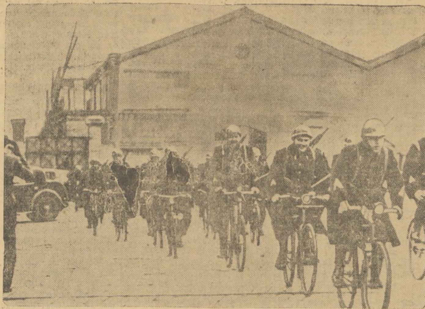
En el puerto de Marsella los obreros se han declarado en huelga. Patrullas de policía vigilan el puerto