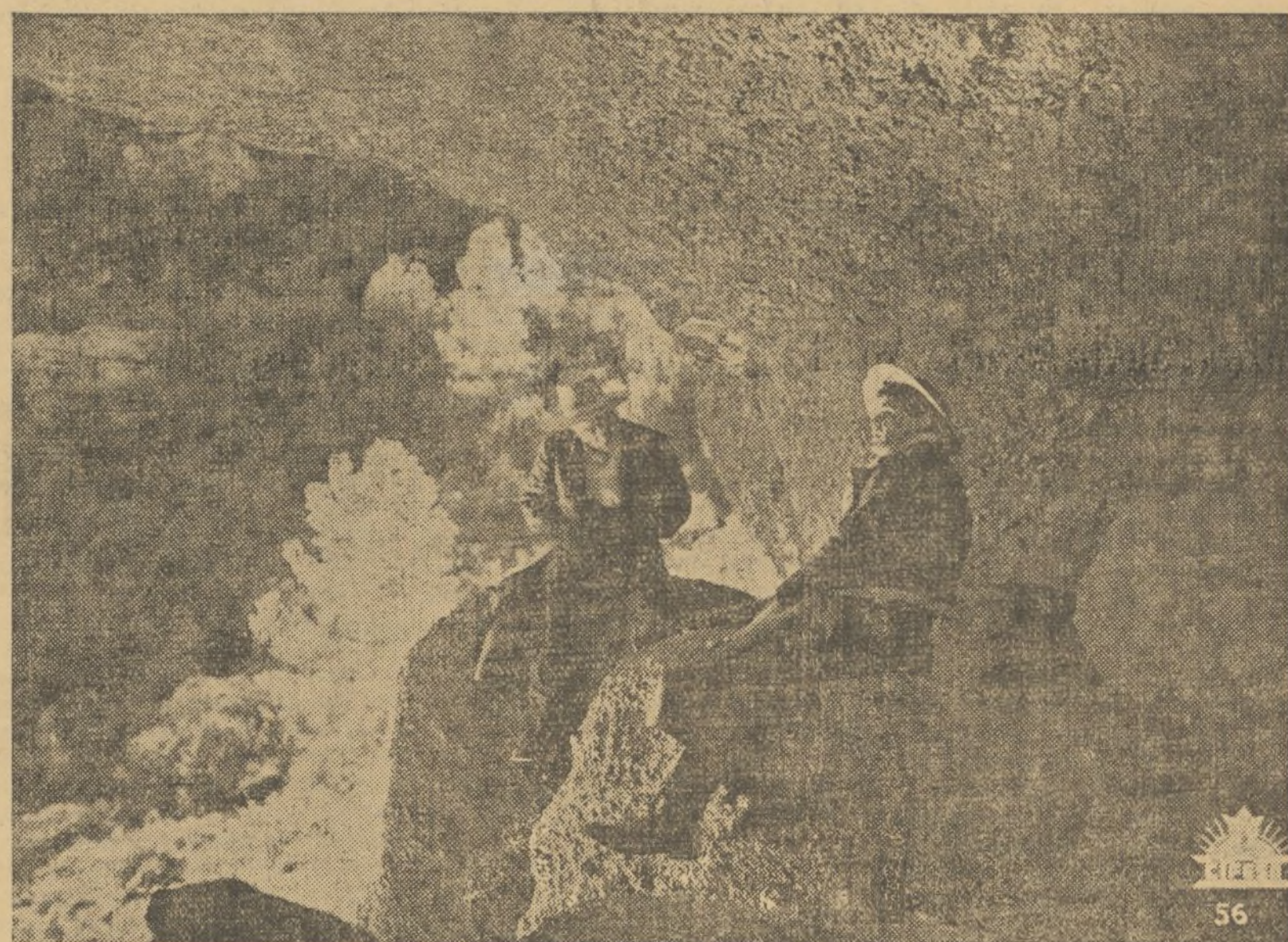
Una interesante escena de la adaptación cinematográfica de la popular ópera del maestro Penella, «El Gato Montés», que la próxima semana presentará CIFESA en el cinema Olympia.