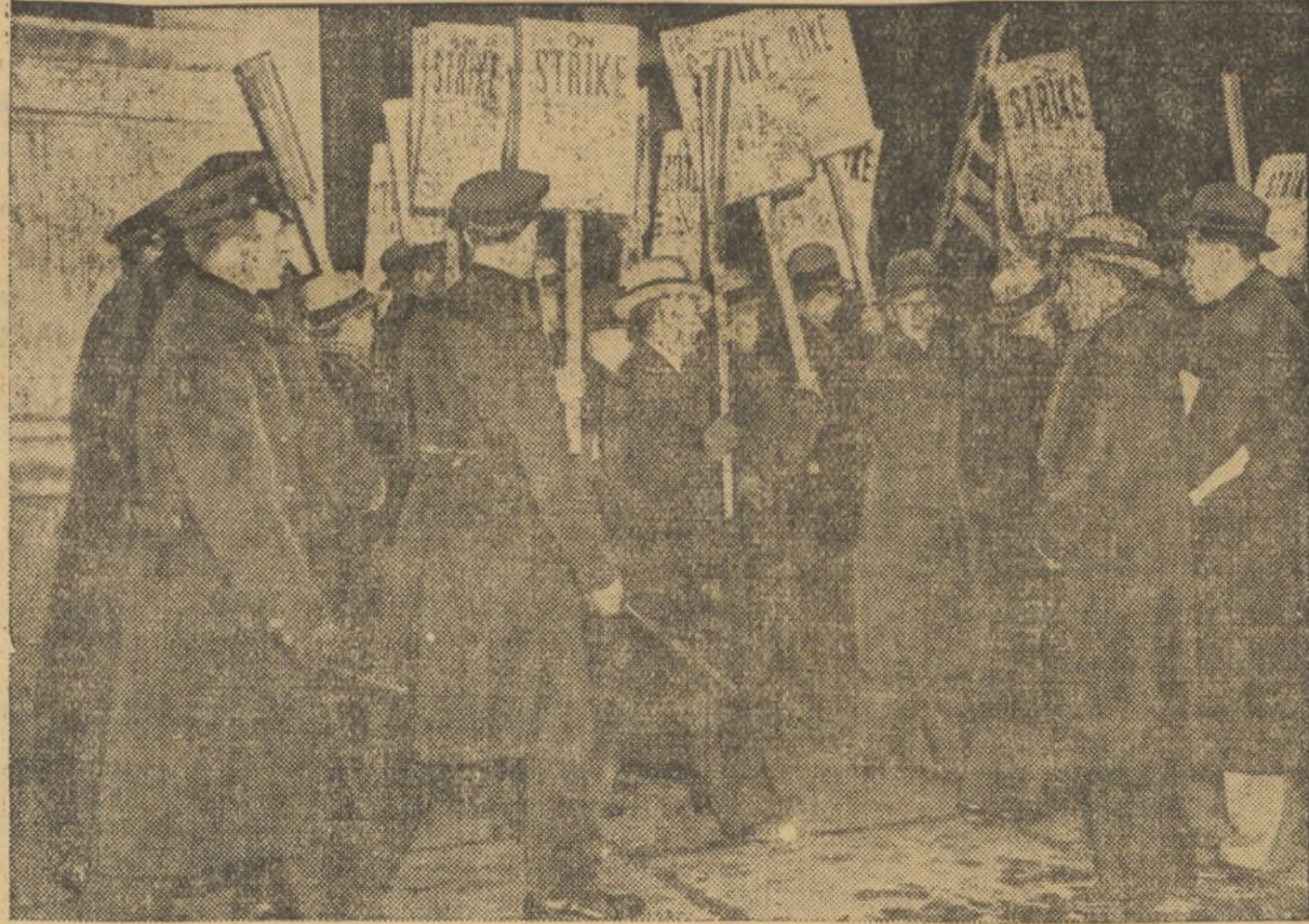
Momento de una manifestación de los huelguistas neoyorkinos que en estos días dificultan la vida de la ciudad. Son los encargados de los ascensores que piden un aumento de sueldo y que en Nueva York, se elevan a más de 10.000