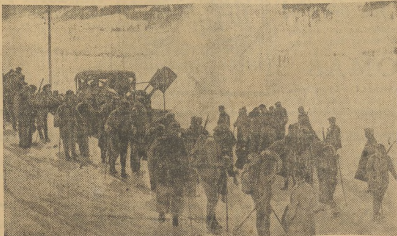
El Touring Club de Francia organiza todos los años en Briançon, un concurso por patrullas para limpiar de nieve las carreteras. Este año la superabundancia de nieve lo hizo tan difícil que sólo un equipo pudo terminar