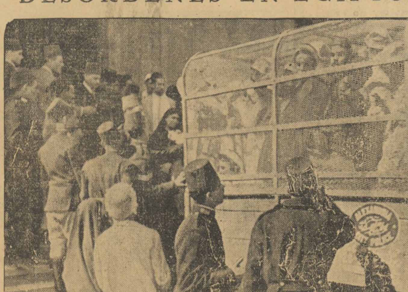
En Alejandría se han reproducido los sucesos de El Cairo, aunque éstos han sido dominados en los primeros momentos. La policía detuvo a muchos manifestantes que en camiones cubiertos de tela metálica fueron llevados a las cárceles