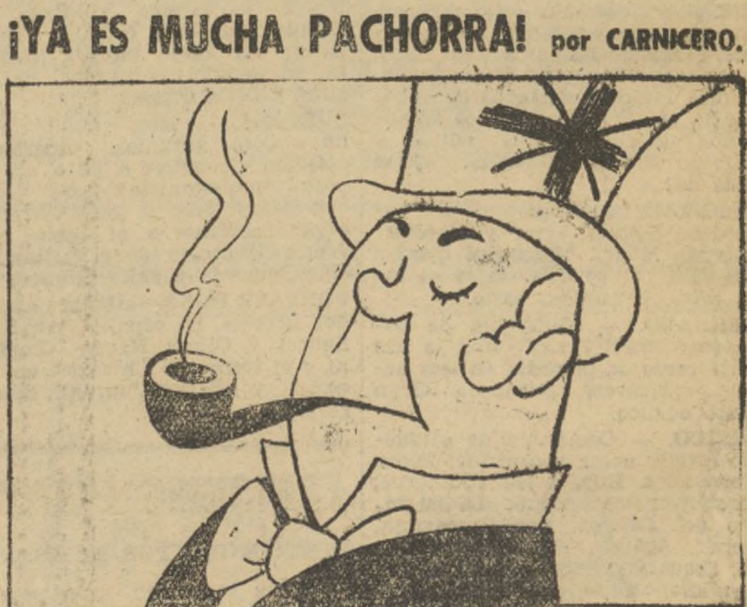
TODOS CONOCEMOS LA FLEMA BRITANICA, PERO...

BARCELONA, 30.—El ministro de Estado estuvo esta tarde en Badalona visitando los lugares afectados por el bombardeo realizado esta mañana por la aviación italiana.