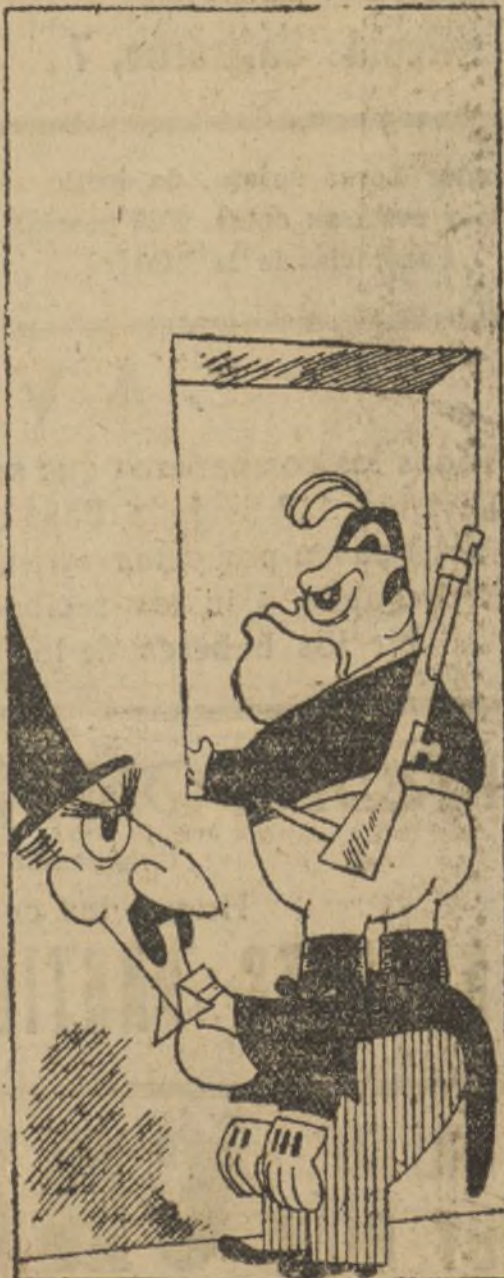
...Y SU TRUCCO.