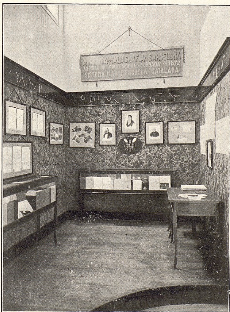
Instalación de la Academia de Taquigrafía en el Palacio de Artes Gráficas

Pocas semanas después, el 27 de Septiembre, la Academia se veía honrada con la visita del Sr. J. B. Estoup, Presidente del Ins-