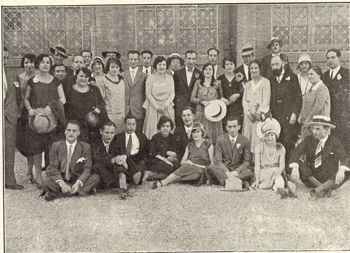
Asistentes al banquete con que la Academia festejó su 57.º aniversario y la inauguración de su "stand" en la Exposición

tándonos al propio tiempo, de que no haya podido tener realidad aquella otra que por su carácter más amplio, por referirse a un aspecto internacional, exigía mayores disponibilidades económicas con que no cuentan estas Asociaciones y que, aunque solicitadas, no han podido ser logradas, y cobijémonos todos bajo el árbol frondoso de nuestra taquigrafía, evocando a su sombra recuerdos que nos ayuden a mantener vivo el interés y el entusiasmo por conservar nuestra propia personalidad, para que no se desvanezca ante apariencias deslumbradoras que impiden, muchas veces, ver el vacío que ocultan y que luego producen amargura y desengaño. Pero no olvidemos nunca la realidad de que por encima de toda taquigrafía, ya sea mecánica o manual, está el factor hombre, cuya inteligencia es