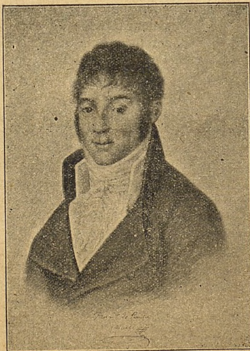
D. FRANCISCO DE PAULA MARTÍ, (Inventor de la Taquigrafía Española)

Saludamos también á nuestros compañeros de profesión quienes penetrados de la utilidad de la Taquigrafía, deploran sin duda con nosotros el lamentable abandono que se halla su enseñanza en España; confiando que no ha de faltarnos su valioso concurso en la obra de propaganda que vamos á emprender; á cuyo fin nos hallamos dispuestos á trabajar cuanto permitan nuestras escasas fuerzas para conseguir que el arte de la veloz escritura adquiera aquí igual desarrollo que en el extranjero.— LA REDACCIÓN.