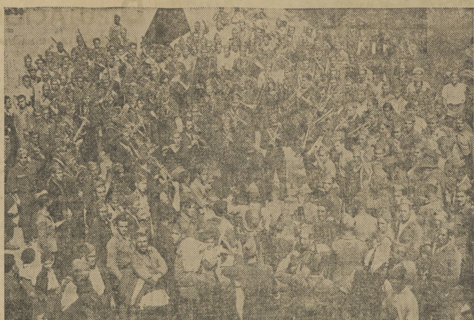
LA BANDA ROJA, DE LA COLUMNA ELIXIA - URIBES, DA SU CONCIERTO EN LA PLAZA DEL PUEBLO