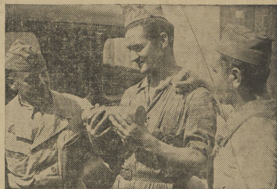
UNA DE LAS MUCHAS GRANADAS QUE CAEN EN NUESTRAS LINEAS SIN ESTALLAR