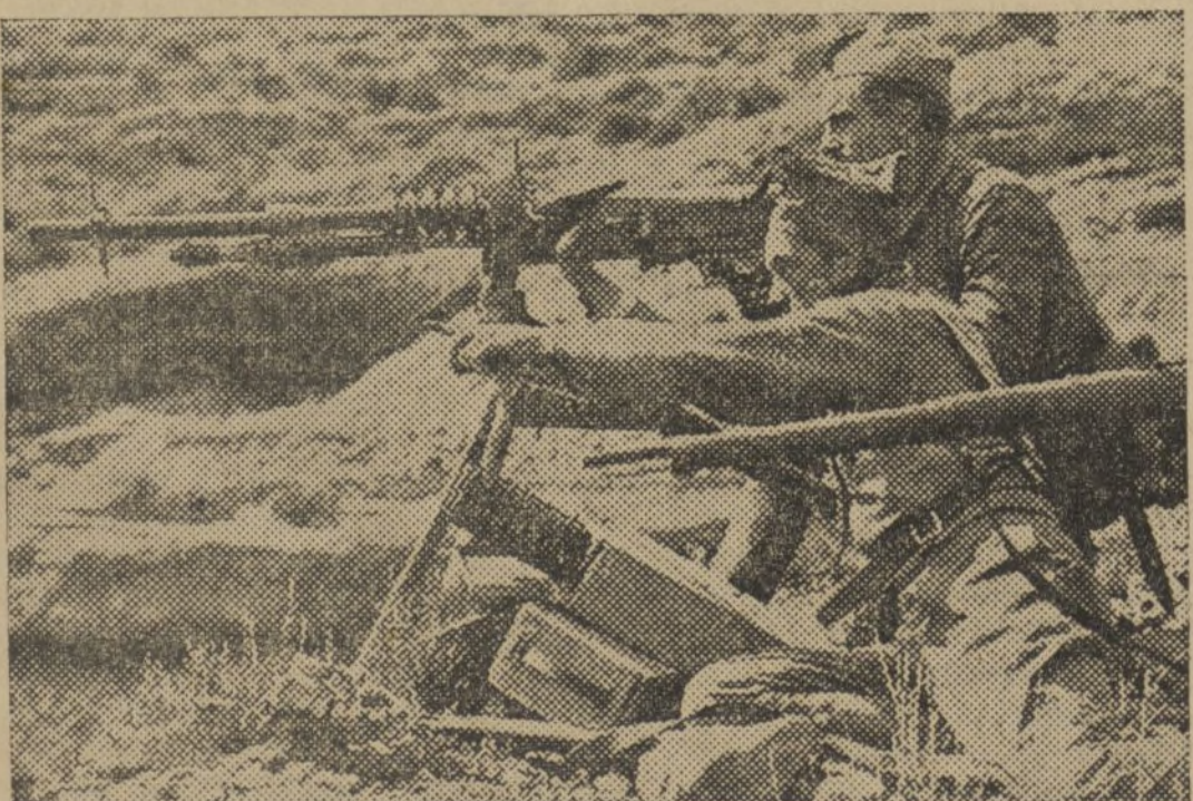
DESDE UN LUGAR ESTRATÉGICO, DEFENDIENDO EL AVANCE DE UNA COLUMNA (SECTOR DE VILLEL, COLUMNA LIXEA-URIBES; FRENTE DE TERUEL)