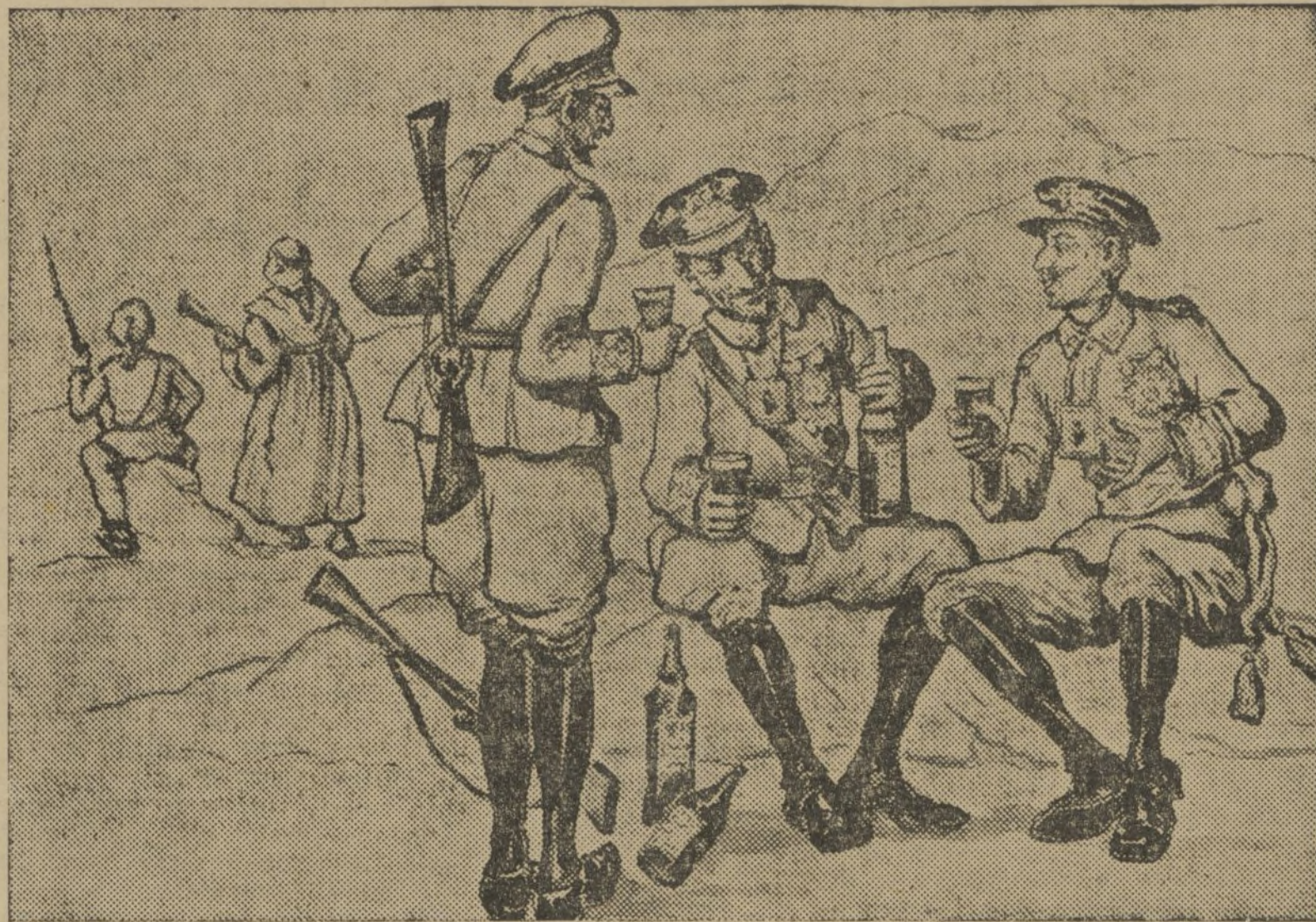
LA PRIMERA VEZ QUE JUGUE PERDI LA VERGUENZA, LA DIGNIDAD Y EL HONOR