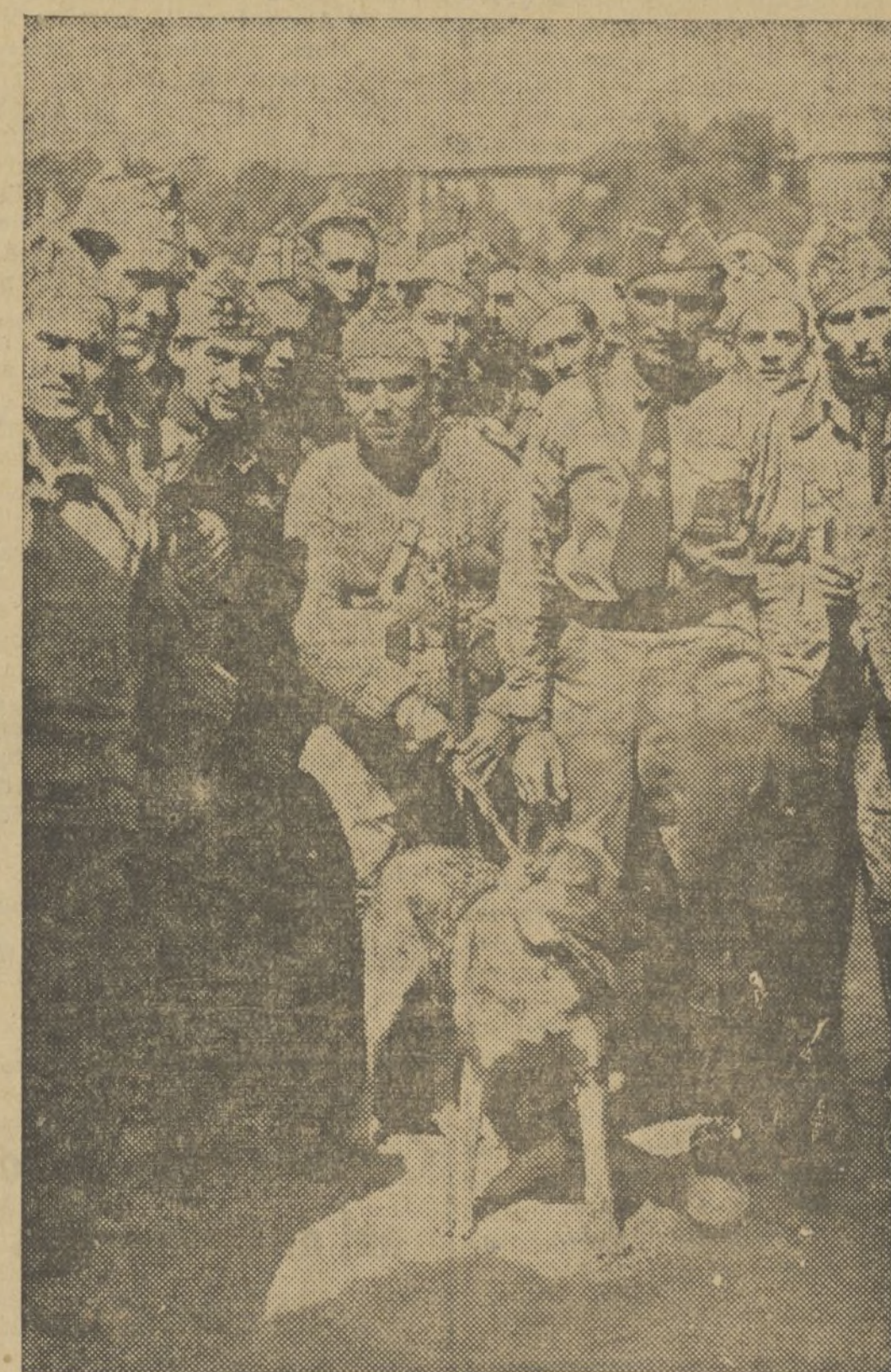
EL PERRO «TOM», CON LOS MILICIANOS QUE FORMAN PARTE EN LA COLUMNA VASCO-CATALANA

En la estación fueron recibidos los expedicionarios por oficiales y