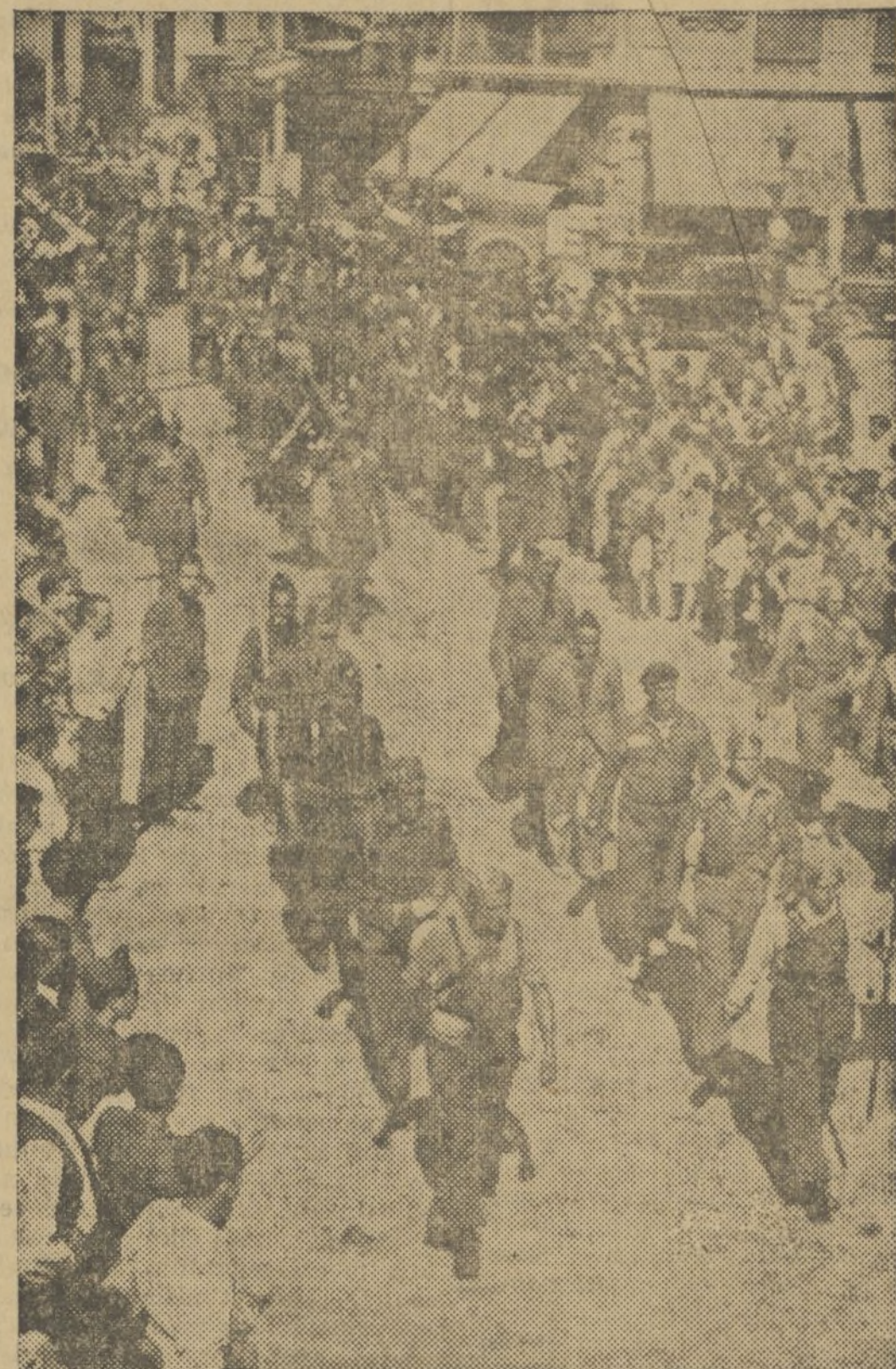
LA COLUMNA VASCO-CATALANA, DESFILANDO POR VALENCIA

espera de la estación y en los andenes, ofreciendo un cuadro desconsolador.