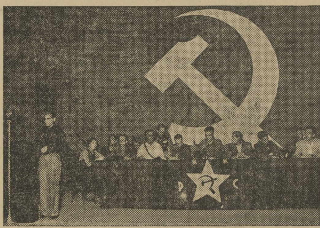
LA GRAN CONFERENCIA PROVINCIAL DEL PARTIDO COMUNISTA

Después, como durante la noche y hoy continuarán, se ini-