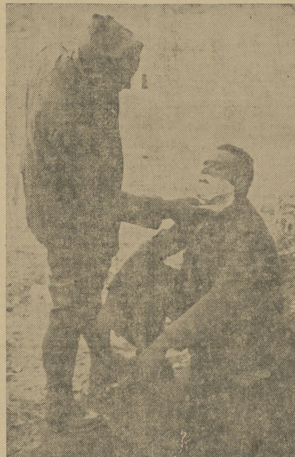
EN PLENO CAMPO DE BATALLA.—LA PELUQUERIA DE LA COLUMNA QUE OPERA EN EL SECTOR DE VILLEL

Por consiguiente, “Tiro desde y contra aeronaves”, cuyo precio es de 12 pesetas, podrá adquirirse por seis pesetas en la Administración de este periódico. A reembolso, 3'50.