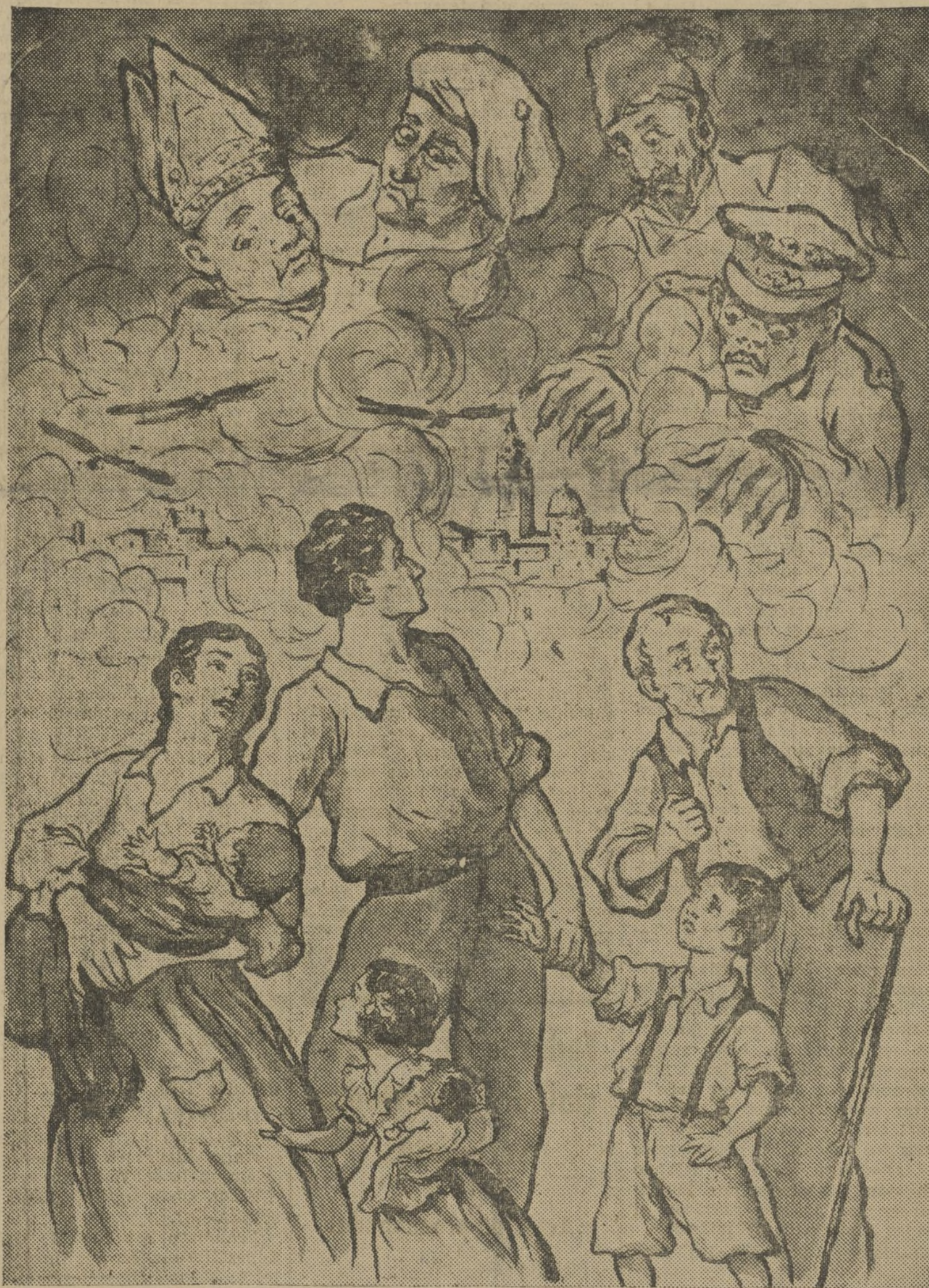
EL PUEBLO MALDICE A SUS ASESINOS

Los carnets de afiliados al Partido de U. R. N. para las organizaciones municipales de los pueblos pueden pedirlos a la secretaría general del mismo.