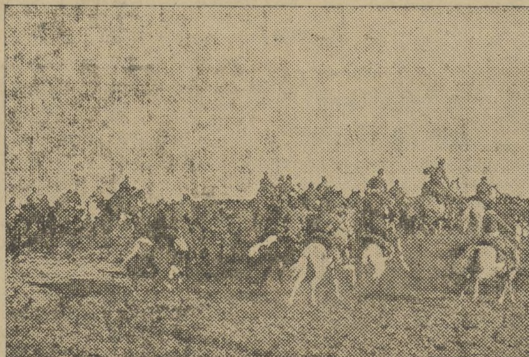
NUESTRA CABALLERIA TOMANDO UNA POSICION EN EL FRENTE DE TERUEL