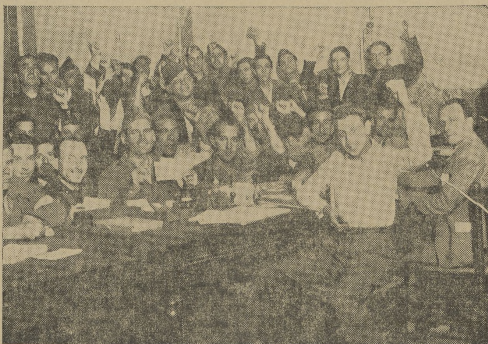
ESTOS MUCHACHOS QUE TAN RISUEÑAMENTE POSAN ANTE EL FOTOGRAFO, SON VOLUNTARIOS PARA DEFENDER LA PATRIA Y LAS LIBERTADES DEL PUEBLO

¡Hay que alistarse en las milicias antifascistas! ¡VAMOS A ALISTARNOS! Mocetones rudos, fuertes, con gesto de bonhomía en el rostro