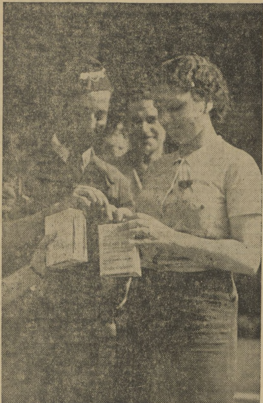
UNA BELLA CAMARADA DELCOMITE POPULAR FEMENINO POSTULANDO EN FAVOR DE LOS NIÑOS MADRILENOS ACOGIDOS EN NUESTRA REGION