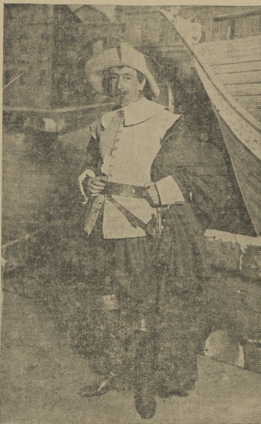
DON JACINTO BENAVENTE, EL ILUSTRE AUTOR, QUE ENCARNO EL CRISPIN DE «LOS INTERESES CREADOS»

Consigamos la gesta con nuestro más entusiasta elogio.