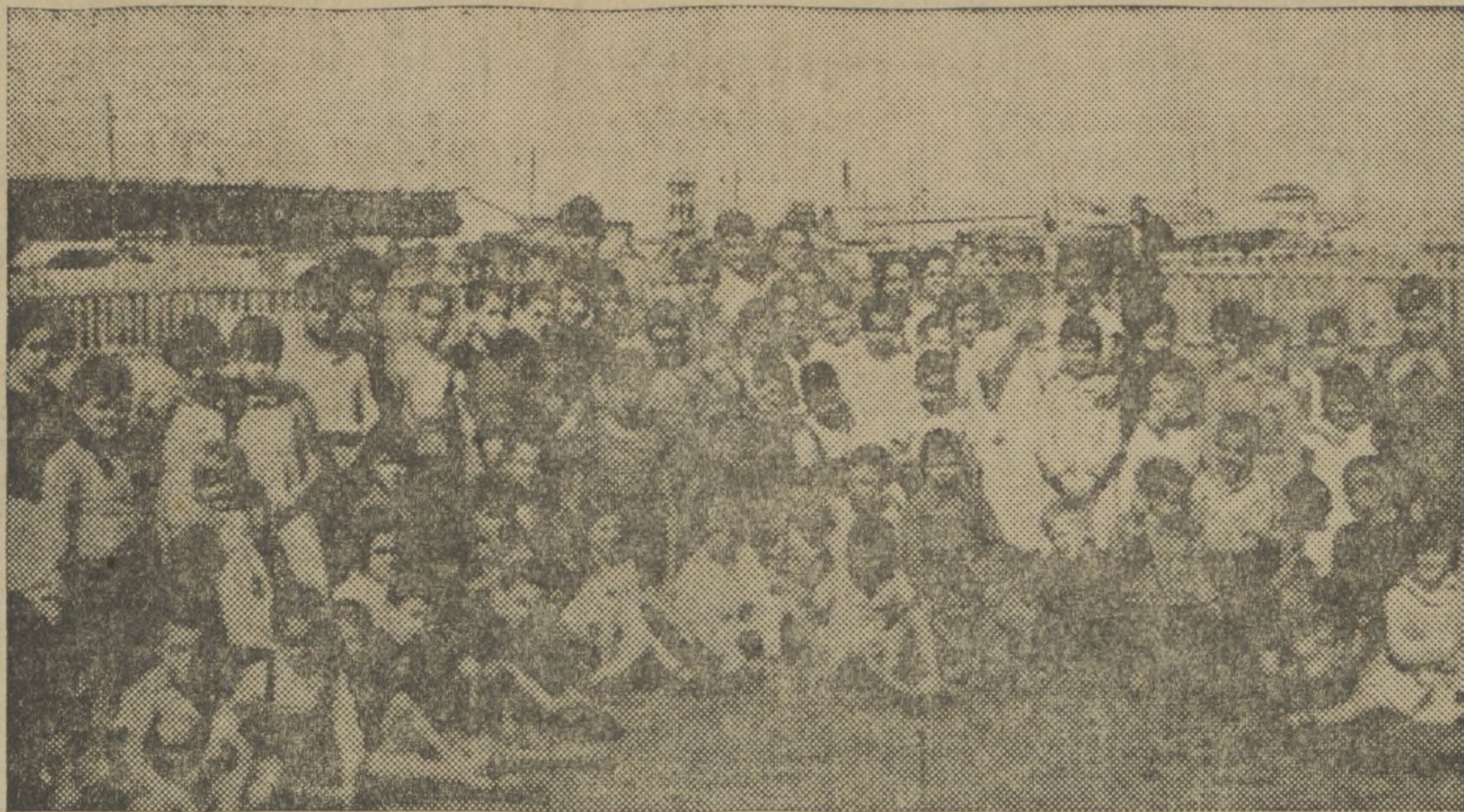
NIÑOS DE LOS LLEGADOS EN UNA EXPEDICIÓN DE MADRID, JUGANDO Y SOLEANDOSE EN LA PLAYA DE LAS ARENAS