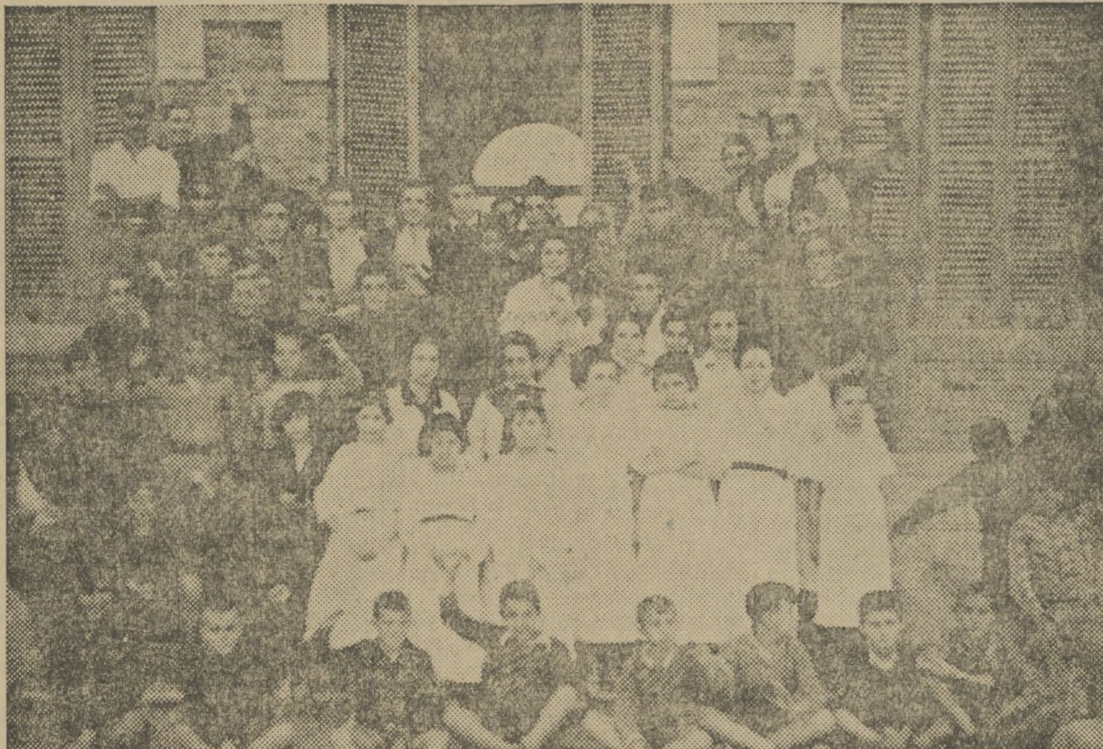
LOS DEL COLEGIO DE HUERFANOS DE MEDICOS, QUE HAN LLEGADO A ESTA Y HAN SIDO ALOJADOS EN LA MALVARROSA