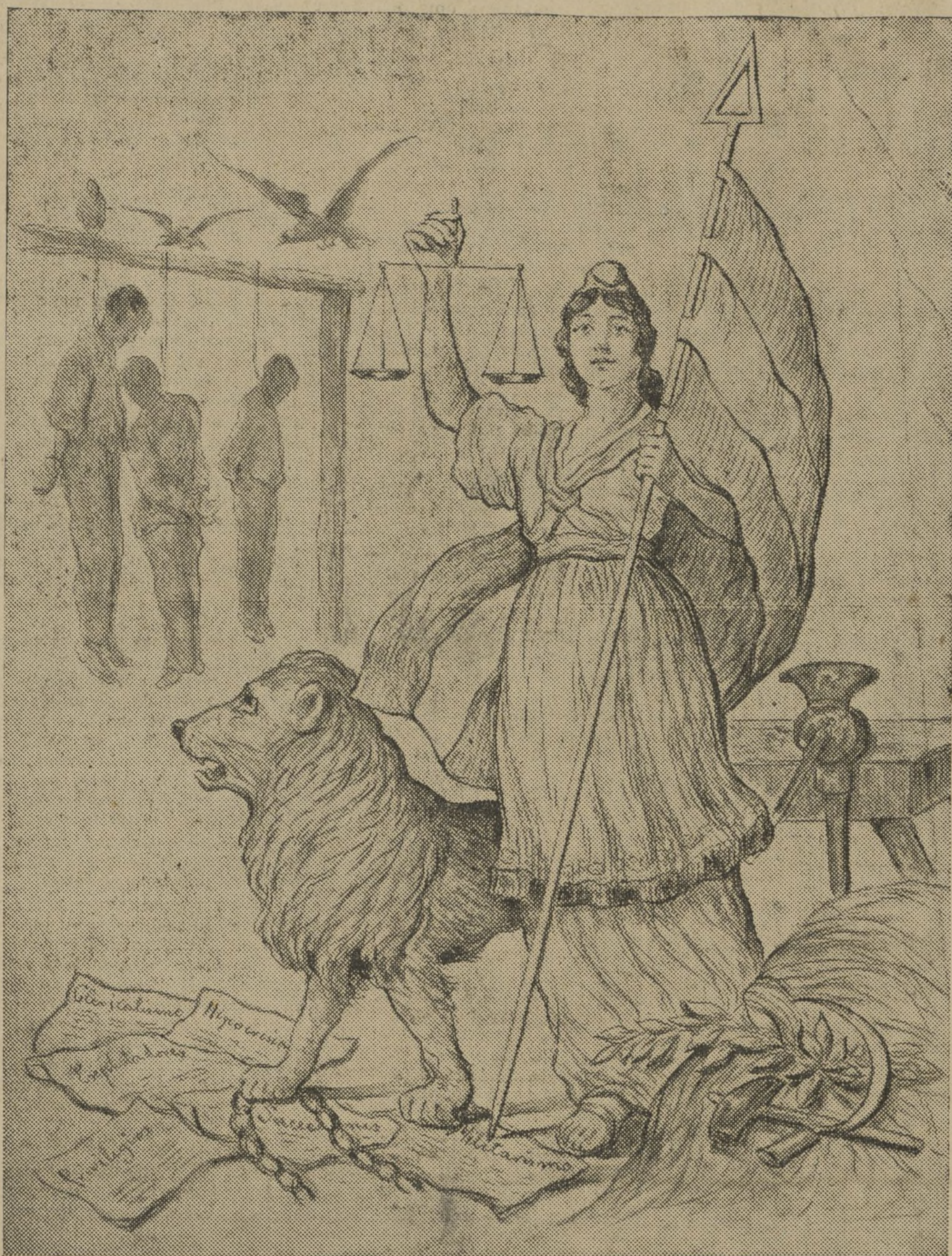
NUESTRA REPUBLICA ¡PENA DE MUERTE AL LADRON!

La consigna capital es la de apoyo incondicional al Gobierno. En cuantos mítines vengo interviniendo, esa consigna adquiere ya categoría forzosa. El Gabinete Largo Caballero es en la actualidad el equivalente al 90 por 100 de voluntad nacional. Por eso es deber de todos apoyarle cumplidamente, acatando sus disposiciones y estimulando sus iniciativas. La democracia republicana y los partidos de tipo proletario están ajustados normalmente a la plaza gubernamental. Y España quiere que se gane la guerra, que equivale a ganar la revolución. Y la consagración de esta moral revolucionaria la regenta el Gobierno, que, dicho con toda claridad y justicia, es el Gobierno del pueblo.