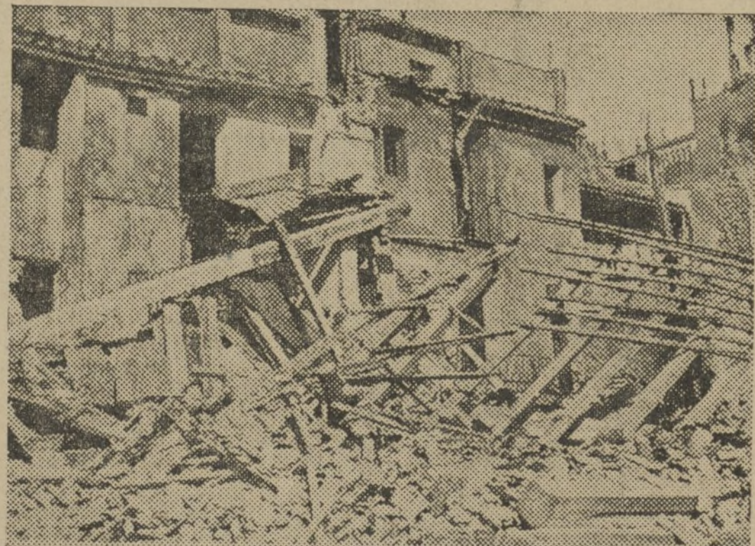
UN DETALLE DE LA CASA HUNDIDA

Se trataba de una construcción viejísima que constaba de dos pisos y planta baja, en la actualidad no ocupada por amenaza ruina.