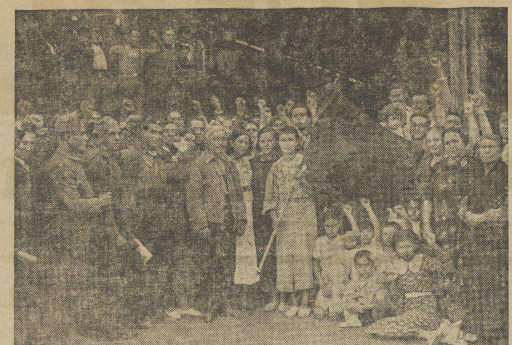
LAS JOVENES DE LA CALLE DE PESARROCHA ENTREGANDO LA BANDERA REGALADA AL GRUPO 18 CENTURIA BERENGUER DE LA COLUMNA TORRES-BENEDICTO QUE LUCHAN EN EL FRENTE DE TERUEL

Noticario soviético U. R. S. S. extensa información rusa.— Jardines de los Alpes, bello documental.— Futuras estrellas, musical Columbia.— Paramount gráfico, reportajes Paramount.— Juventudes felices (soviets deportivo), el más grandioso documental que existe.— Pájaros azules, gracioso y bello dibujo en técnico- Columbia