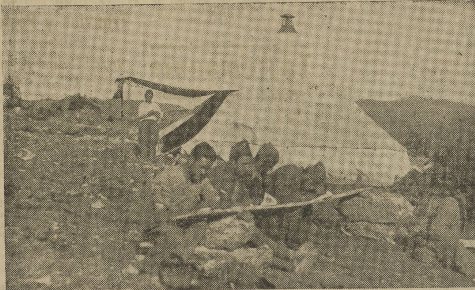
ESTOS MILICIANOS APROVECHAN EL REPOSO, EN UN DIA DE SOL OTONAL, PARA ESCRIBIR A LOS SUYOS DESDE EL CAMPAMENTO

Pero resultó contraproducente tal sacrificio, pues apercibido el enemigo de la salida de aquel auto a gran velocidad, taponó la carretera con ganado a un kilómetro del pueblo y en la primera vuelta, quedando empujado el coche sobre la cuneta, después de haber matado catorce ovejas, lo que aprovechó un nutrido grupo de fascistas, bien parapetados, para disparar sus fusiles sobre los ocupantes del coche, que se defendieron disparando todas las municiones de