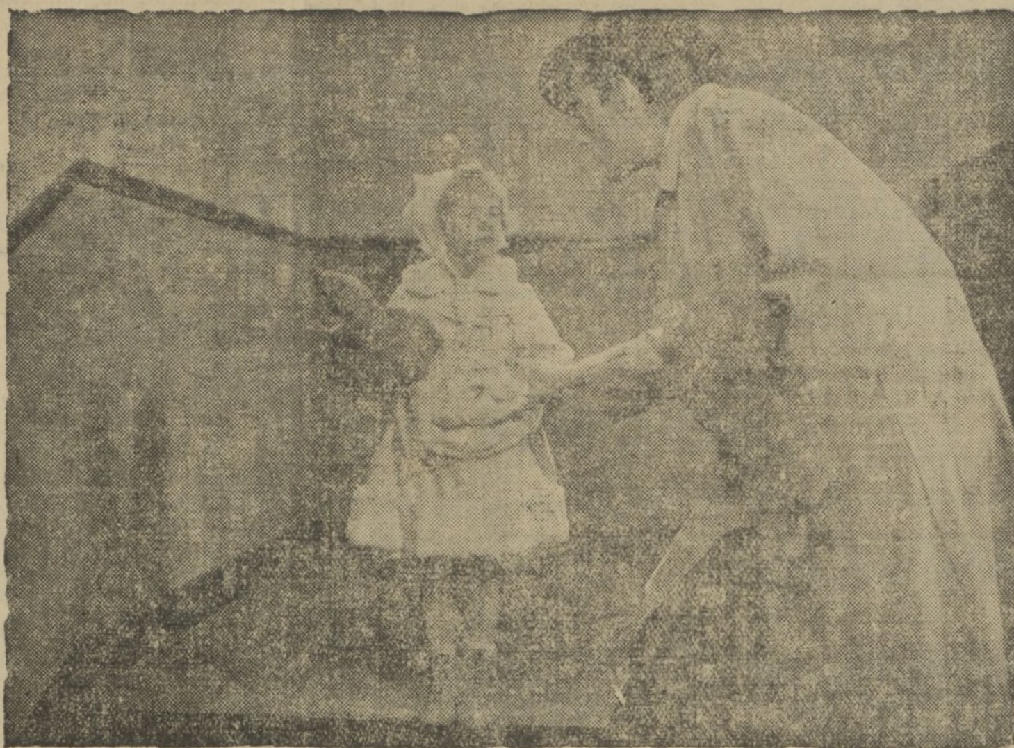
UNA ESCENA DE LA PELICULA ESPAÑOLA «¿QUIÉN ME QUIERE A MÍ?», CON LA QUE HIZO SU INAUGURACION EL CAPITOL, CON UN LISONJERO EXITO