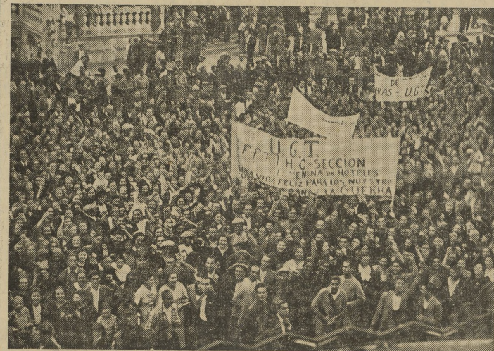
UN ASPECTO DE LA MANIFESTACION A SU PASO POR LA PLAZA DE CASTELAR

do en defensa de los intereses de los trabajadores organizados, sienten la necesidad de hacer pública su más enérgica protesta, haciendo constar que en ningún momento, desde su constitución, este Comité ni las respectivas organizaciones de quienes depende, olvidaron los altos intereses de la Revolución y las necesidades de guerra