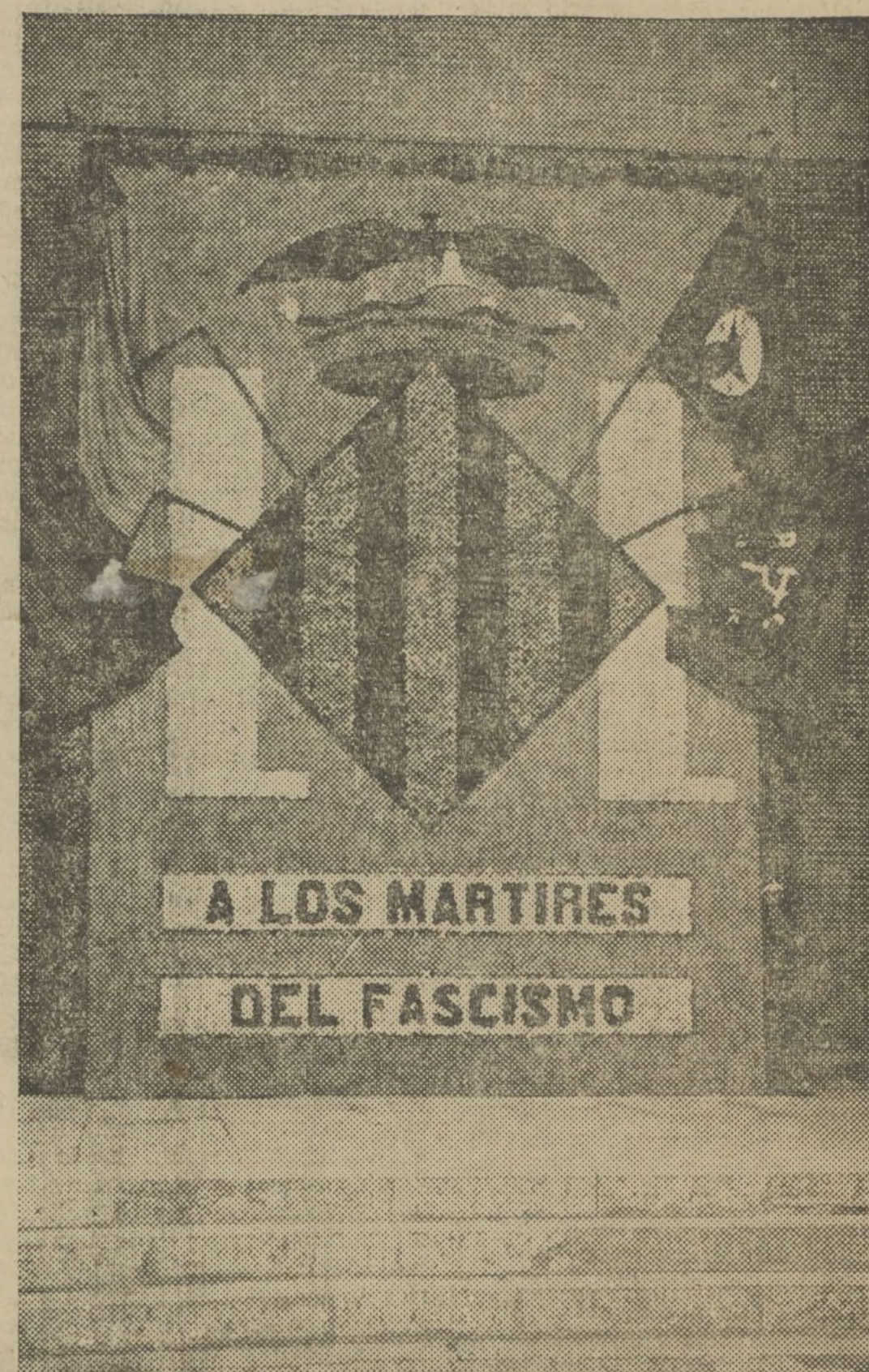
TAPEZ DE FLOR NATURAL, COLOCADO EN EL CEMENTERIO POR EL AYUNTAMIENTO, PARA LA FECHA DEL PRIMERO DE NOVIEMBRE