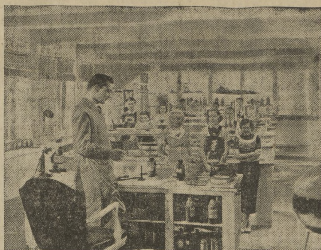
UNA ESCENA DE «ESCÁNDALO ESTUDIANTIL», PELÍCULA DIÁLOGADA EN ESPAÑOL, DE LA PARAMOUNT, QUE ESTRENA EL OLYMPIA EL PROXIMO LUNES

Por de pronto, podemos anticipar, según leemos en la Prensa barcelonesa, que el Sindicato Único de Espectáculos Públicos de Cataluña, ha creado un Comité de producción, y lo segundo, preocu-