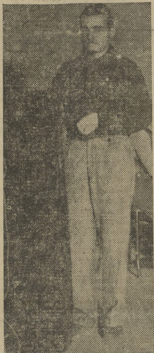
España y de los avances sociales que la situación de guerra que vivimos permitan.

Para lograrlo en toda su extensión, el Consejo de Economía habrá de tener en todas sus actividades una relación lo más estrecha posible con los órganos del Poder central a fin de que las decisiones y acuerdos del Consejo de Economía estén en todo momento en absoluto de acuerdo con las necesidades de la guerra en toda